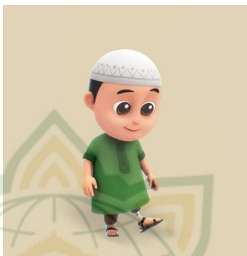
Gambar 4.2 Pemeran Nussa

Karakter animasi Nussa digambarkan sebagai kakak laki-laki yang memakai kopyah dan jubah putih, yang umum di kalangan anak laki-laki Muslim. Sebagai anak penyandang disabilitas, Nussa perlu memakai prostetik untuk menopang dirinya di siang hari karena salah satu kaki kirinya tidak berkembang secara normal. Nama karakter Nussa berasal dari kata "Nusantara", dan dengan menggunakan moniker itu, tim produksi berharap dapat menonjolkan keragaman dan keberadaan negara Indonesia ke dunia luar. Nama karakter tersebut juga dimaksudkan untuk mengingatkan penonton bahwa animasi ini lebih terkenal di bidang film animasi dan terinspirasi dari kecintaan terhadap barang-barang rumah tangga. Karakter utama, Nussa, ditampilkan kepada masyarakat umum. Dia memiliki semangat yang tinggi, taat pada agama, sopan dan tidak menuntut, dan dia juga mencintai dan selalu mengarahkan adiknya ke jalan yang benar.