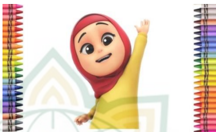
Gambar 4.3 Pemeran Rarra

Karakter animasi Rara digambarkan sebagai anak yang menyenangkan dan adik perempuan. bocah lima tahun yang selalu berbusana muslim, termasuk berhijab. Nama Rara, yang melengkapi istilah "Nusantara", berasal dari kata "Nusantara" atau "ara", yang disusun berdasarkan pemanasan karakter utama animasi ini. Untuk membuat animasi keluarga dan memperkenalkan animasi asli Indonesia, karakter Nussa, Rara, dan Anta saling berhubungan. Penonton yang menonton sangat heboh dengan kenafian karakter Rara.