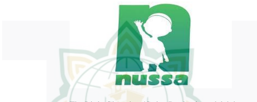
Gambar 4.1 Logo Nussa & Rarra