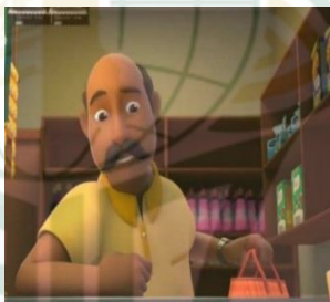
Gambar 4.7 Pemeran Pak Ucok

Pak Ucok juga telah dimasukkan sebagai karakter dalam animasi. Pak Ucok ditampilkan sebagai penjaga toko yang dermawan dengan logat Betawi yang kental, tidak pelit dan senang melihat anak-anak di tokonya. Karakter ini memiliki kualitas yang unik, seperti lucu tapi tidak berlebihan sehingga membuat penonton tertawa. Aksen Betawi yang ditambahkan oleh Pak Ucok adalah aspek yang paling menonjol dari karakter ini, yang juga berfungsi sebagai pemanis untuk membuat animasi lebih berwarna dan beragam. Daftar karakter dewasa dari kartun Nussa dan Rara di YouTube sekarang termasuk karakter Pak Ucok ini.