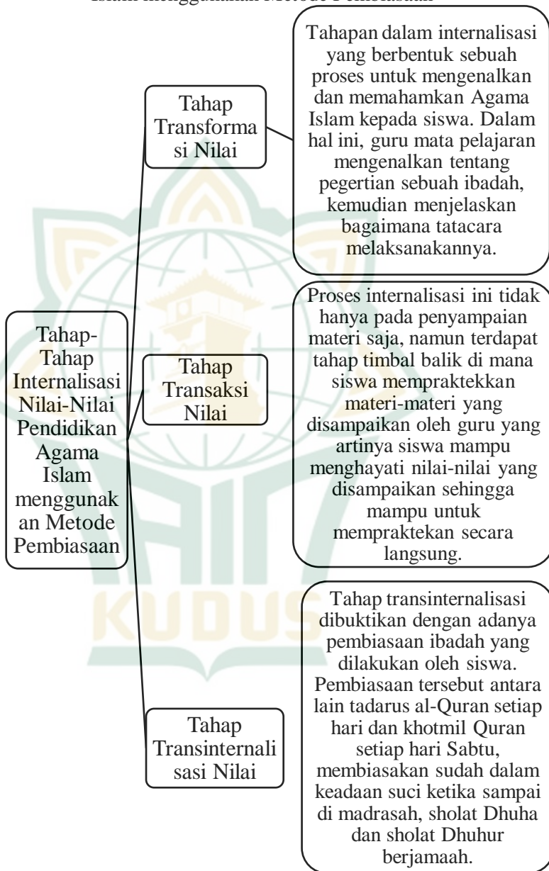
Gambar 4.1 Tahap-Tahap Internalisasi Nilai-Nilai Pendidikan Agama Islam menggunakan Metode Pembiasaan