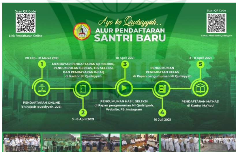
Gambar 5. Brosur PPDB Madrasah Aliyah Qudsiyyah Kudus Tahun Pelajaran 2021-2022

Syarat pendaftaran peserta didik baru di Madrasah Aliyah Qudsiyyah Kudus meliputi mengisi formulir pendaftaran via online, mengumpulkan berkas seperti fotocopy akte kelahiran 2 lembar, fotocopy KTP bapak dan ibu atau wali yang diperbesar 2 kali 2 lembar, fotocopy kartu keluarga 2 lembar, fotocopy ijazah terakhir dan SKHUN 2 lembar, fotocopy raport terakhir 2 lembar, fotocopy kartu KIP/PKH/KPS 2 lembar, dan semua persyaratan dimasukkan kedalam stopmap warna hijau. 52