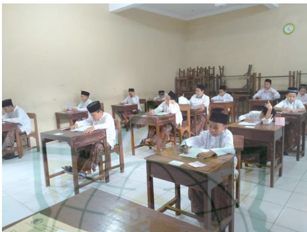
Gambar 6. Tes Tertulis di Madrasah Aliyah Qudsiyyah Kudus