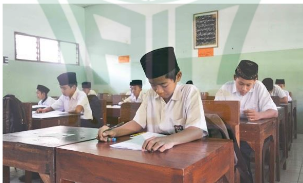
Gambar 2. Tes Tertulis di Madrasah Aliyah Tasywiqhut Thullab Salafiyah (TBS) Kudus

Jika calon peserta didik dinyatakan lolos seleksi maka bisa langsung masuk di kelas X Madrasah Aliyah Tasywiqhut Thullab Salafiyah (TBS) Kudus. Akan tetapi, jika calon peserta didik tersebut dinyatakan tidak lolos dalam seleksi penerimaan peserta didik di Madrasah Aliyah Tasywiqhut Thullab Salafiyah (TBS)