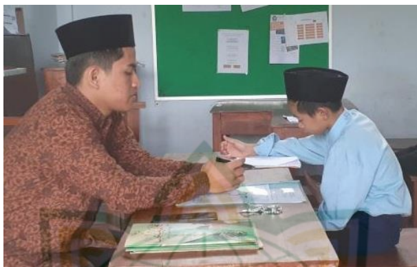
Gambar 1. Tes Lisan di Madrasah Aliyah Tasywiqhut Thullab Salafiyah (TBS) Kudus

Sedangkan tes tulis yang di ujikan di Madrasah Aliyah Tasywiqhut Thullab Salafiyah (TBS) Kudus adalah Tes Potensi Akademik (TPA), IPA, IPS, Bahasa, dan Agama. 44