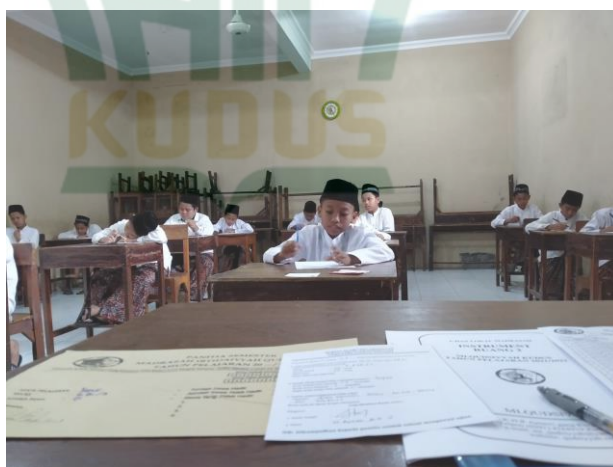
Gambar 6. Tes Lisan di Madrasah Aliyah Qudsiyyah Kudus