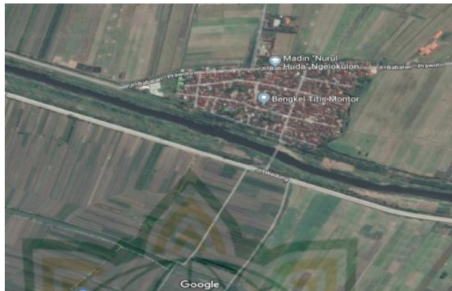
Gambar 4.1 Peta Desa Ngelokulon, Kecamatan Mijen, Kabupaten Demak. 2

Luas wilayah Desa Ngelokulon adalah 277.590 hektar, terbagi dalam beberapa peruntukan seperti luas tanah kas desa 45 hektar, luas bengkok pamong 26955 hektar, luas komplek balai desa 0.0200 hektar, luas tanah kuburan 0.0200 hektar, luas tanah lapangan 0.8000 hektar, sawah masyarakat 165970 hektar, luas tegalan 30 hektar, luas pekarangan penduduk 12 hektar, luas tanah wakaf 12 hektar.