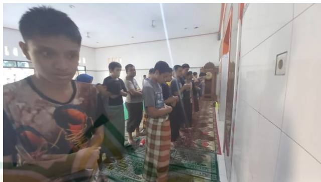
Gambar 4.7 Autis Mandiri Melaksanakan Sholat Berjama'ah

Pernyataan tersebut selaras dengan yang disampaikan Ibu Noor Ismawati selaku guru pengajar anak autis dalam proses pembelajaran, beliau menyampaikan bahwa pembelajaran di pondok pesantren ini berbeda metodenya dengan pondok yang lainnya, karena pondok pesantren ini khusus untuk anak autis. Pembelajaran itu melalui teori, gambar visual atau suara rekaman. Anak autis yang mandiri diajarkan soal teori ibadah sholat, beda dengan anak autis yang komunikasinya masih satu arah guru mengajarkan secara langsung untuk sholat. Kegiatan membaca al-Qur'an, guru memberikan tajwid yanbu'a, satu anak membacanya sambil diajari berulang-ulang dengan satu huruf hijaiyyah sampai paham. Untuk ibadah puasa guru menganjurkan anak-anak autis untuk mengikuti puasa walaupun masih dasar latihan itu sebagai bentuk pembiasaan yang sudah diterapkan. 28