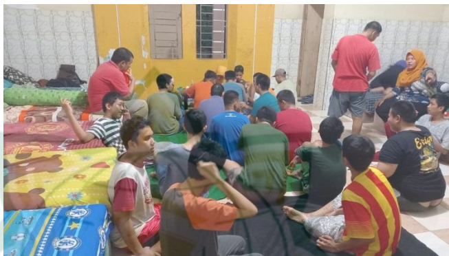
Gambar 4.8 Proses Pembelajaran Tajwid Secara Bergantian

Komunikasi interpersonal atau komunikasi antarpribadi merupakan komunikasi yang biasa terjadi dalam kehidupan manusia. Komunikasi ini juga diterapkan di pondok pesantren Al-Achsaniyyah. Seperti yang telah disampaikan oleh Bapak Yudi selaku kepala sekolah atau humas di pondok pesantren, beliau menyatakan bahwa guru menyesuaikan kondisi anak autis yang mempunyai karakter berbeda-beda. Ada anak yang komunikasinya mudah dan ada yang komunikasinya sulit. Untuk komunikasi interpersonal atau antarpribadi sangat efektif digunakan guru untuk mengajarkan anak autis dalam pembiasaan ibadah. Dimulai dari pendekatan personal antara guru dengan anak autis, kemudian masuk kelas one on one. 30