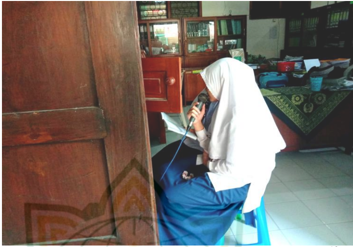
Gambar 4.3. Siswa memimpin doa awal belajar di kantor. 10

Setelah itu, pukul 07.10-07.20 WIB dilanjutkan mengaji juz Amma bersama di kelas masing-masing yang didampingi oleh guru pendamping atau guru mata pelajaran yang mengajar pada saat jam pertama. Setiap siswa harus memiliki Juz Amma sendiri yang dibaca dalam kegiatan tersebut.