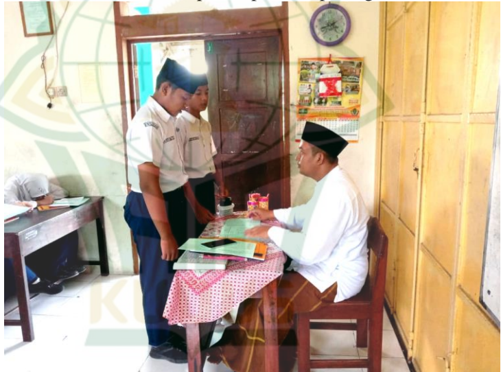
Gambar 4.6. Guru mendampingi kegiatan Musyafahah dan Tahfidzul Qur'an. 16

Tahfidzul Qur'an dilakukan pada saat setelah kegiatan belajar mengajar. Setiap kelas memiliki jadwal yang berbeda dan juga guru pendamping yang berbeda juga. Contohnya yaitu kelas VIII A dilakukan setiap hari Selasa pukul 13.30 WIB. Setiap siswa memiliki buku monitoring prestasi sendiri terkait dengan hafalannya. Dimulai dari pukul 13.30 WIB guru pendamping masuk ke kelas. Pukul 13.30-13.40 WIB siswa membaca surat Al-Fatihah dan Tahiyat sebagai doa awal sebelum kegiatan dimulai. Selanjutnya pukul 13.40-14.05 WIB siswa maju kedepan untuk menyetorkan hafalannya kepada guru pendamping. Siswa yang hafalannya sama, bisa maju menyetorkan hafalannya bersama temannya. Setelah semua siswa selesai hafalan, dilanjutkan membaca doa untuk penutupan dan pulang. 15