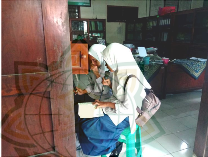
Gambar 4.5. Siswa memimpin doa akhir belajar di kantor. 13

Ada pembacaan doa awal belajar juga ada pembacaan doa akhir belajar yang dilakukan setelah pembelajaran selesai dan sebelum siswa pulang. Pembacaan doa akhir belajar dilakukan sama dengan pembacaan doa awal belajar yaitu pembacaan doa dipimpin oleh dua orang siswa melalui speaker di kantor. 12