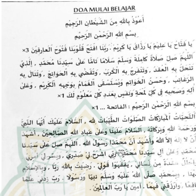
Gambar 4.6. Bacaan Doa Awal Belajar