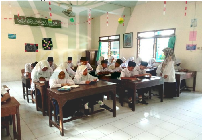
Gambar 4.4 Guru mendampingi siswa mengaji Juz Amma bersama. 11

Setelah itu, pukul 07.10-07.20 WIB dilanjutkan mengaji juz Amma bersama di kelas masing-masing yang didampingi oleh guru pendamping atau guru mata pelajaran yang mengajar pada saat jam pertama. Setiap siswa harus memiliki Juz Amma sendiri yang dibaca dalam kegiatan tersebut.