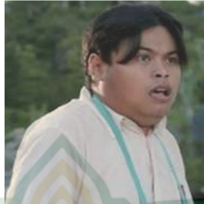
Gambar 4.2 Profil Tokoh Ondeng

yang melalui jembatan untuk dapat menempuh pendidikan di SD Towea.