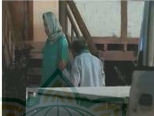
Gambar 4.16 Pak Guru Mengajak Bu Farida untuk Shalat Subuh

Nilai akhlak bertaqwa disampaikan melalui potongan adegan Pak Mone yang melaksanakan shalat subuh diatas perahu. Diperlihatkan screenshoot dalam potongan adegan film Jembatan Pensil pada gambar 4.15. Diperkuat dengan pelaksanaan sholat shubuh oleh Pak Mone. Selanjutnya, nilai akhlak bertaqwa disampaikan juga melalui potongan adegan Pak Guru menasehati istrinya. Diperlihatkan screenshoot dalam potongan adegan film Jembatan Pensil pada gambar 4.16. Diperkuat dengan dialog yang diucapkan oleh Pak Guru untuk lebih baik melaksanakan shalat terlebih dahulu walaupun dalam keadaan ingin segera mencari keberadaan anaknya.