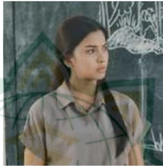
Gambar 4.10 Profil Tokoh Aida

kapal Pak Mone meskipun harus turut menginap di tengah laut. Sehabis sampai di rumah, keesokannya Aida dengan suka hati turut menolong Pak Guru mengajar di SD Towea walaupun tanpa biaya. Aida pula mengajak murid-muridnya pergi ke bukit tinggi supaya dapat belajar pada alam.