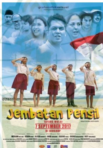
Gambar 4.1 Poster Film Jembatan Pensil

Film Jembatan Pensil mengangkat mengenai kehidupan anak-anak sekolah dasar dalam perjuangannya terus belajar. Walaupun, mereka wajib berjalan jauh serta menyebrangi jembatan yang sudah rapuh. Ditambah lagi dengan situasi anak-anak berkebutuhan khusus yang secara fisik serta psikologis tidak sempurna. 3 Tetapi seluruhnya senantiasa antusias mengenyam pendidikan didalam kelas ataupun di alam.