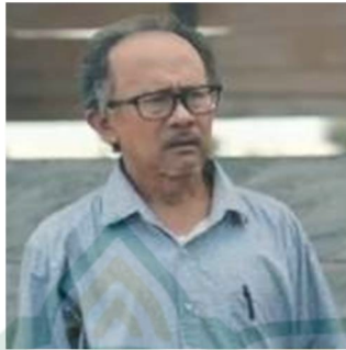
Gambar 4.13 Profil Tokoh Pak Guru

kekurangan.” Pak Guru juga sosok yang sabar saat berhadapan dengan istrinya yang dikatakan amat cerewet.