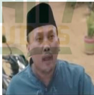
Gambar 4.14 Profil Tokoh Ja'far

Ja'far merupakan pamannya Aida. Ia umumnya kerap membagikan khotbah di masjid. Hatinya bagus juga pengertian. Hal ini terbukti dikala Aida belum pula sampai rumah ketika dikabari hendak pulang, Ja'far turut risau. Ja'far pula termasuk bijaksana, ia membela Pak Guru kala disalahkan Farida sebab lebih memilih pergi mengajar di sekolah gratisan daripada mencari buah hatinya yang belum kembali.