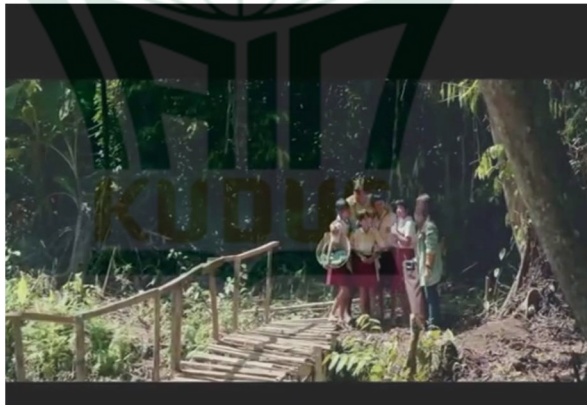
Gambar 4.25 Inal, Azka, dan Nia Menyalami Bu Guru Aida Ketika Berpapasan

Allah menegaskan betapa besar jasa serta perjuangan seseorang ibu dalam memiliki, menyusui, menjaga serta ceria buah hatinya. Setelah itu ayah sekalipun tidak turut memiliki serta menyusui, tetapi ia bertugas besar dalam mencari nafkah, membimbing, mencegah, membesarkan serta ceria buah hatinya sampai sanggup berdiri sendiri apalagi hingga durasi yang tidak terbatas. Bersumber pada seluruhnya itu, pasti amat