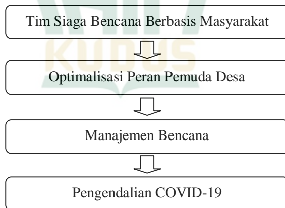
Gambar 2.3 Bagan Kerangka Berpikir Penelitian

Metodologi penelitian mendefinisikan kerangka berpikir sebagai logika teoritis dari seorang peneliti yang diperkuat oleh teori-teori dan penelitian terdahulu yang terkait dengan permasalahan pembahasan dalam penelitian yang dilakukan 40 . Kerangka berpikir penelitian ini tergambarakan melalui bagan di bawah ini.