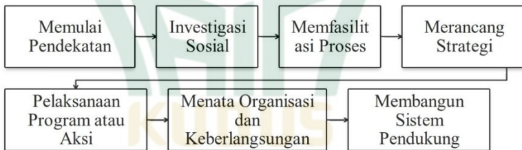
Gambar 2.2 Tahapan Pengorganisasian Masyarakat

Berdasarkan teori pengembangan masyarakat, proses pengorganisasian masyarakat atau komunitas mempunyai tujuan umumnya sebagai upaya untuk memjabarkan kebutuhan, mengatasi ketidakmampuan, serta menjaga keseimbangan antara ketersediaan sumber daya dan kebutuhan sosial. 26 Sedangkan tahapan pengorganisasian masyarakat dalam pemberdayaan menurut Afandi, dkk (2015) adalah sebagai berikut. 27