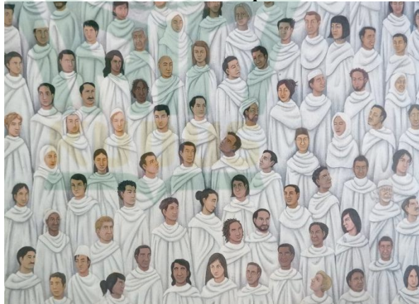
Gambar 4. 5 Capture gambar Orang-orang yang berpakaian serba putih yang terdapat dalam lukisan “Buraq”

Gambaran sekumpulan orang-orang yang berbeda jenis kelamin namun menggunakan pakaian yang serba putih seperti pakaian ihram.