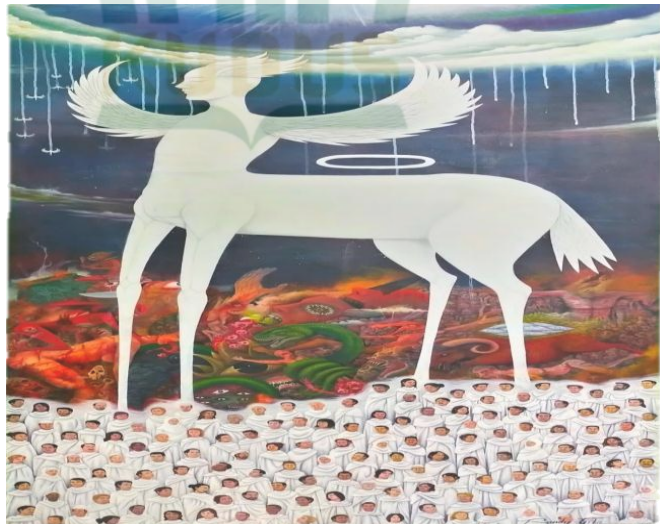
Gambar 4. 4 Lukisan “Buraq” karya Randi Gita Setyoko.

jenjang, serta ekor yang tidak terlalu panjang, berbeda dari hewan tunggangan pada umumnya, wajah Buraq digambarkan mirip dengan wajah manusia, telinganya panjang dan memiliki sayap yang menyerupai burung yang terdapat diantara kedua kakinya, di atas tubuh hewan yang diduga Buraq itu terdapat sebuah lingkaran berwarna putih. Tidak hanya sosok Buraq , karya ini juga turut menampilkan banyak figur pendamping seperti sosok mitologi yang terlihat menyeramkan seperti hewan bertanduk, ular, potongan tubuh manusia, kerangka tubuh dan lain sebagainya, terdapat juga banyak manusia baik laki-laki maupun perempuan dengan mengenakan pakaian serba putih. Pada lukisan ini juga turut digambarkan awan dan cahaya matahari serta langit yang bergradasi warna. Lukisan ini menerapkan beberapa unsur seni lukis seperti garis, tekture, warna, balance /keseimbangan, dan lain sebagainya, namun yang sangat mencolok dari lukisan ini adalah pada penggunaan warna. Pada lukisan ini warna yang mendominasi adalah warna merah (warna panas), warna biru (warna dingin) serta warna putih. Dalam karya lukis ini terlihat suasana cerah yang digambarkan oleh langit yang berwarna biru dengan awan cerah serta efek cahaya dari penggunaan cat berwarna putih dan highlight hijau kekuningan.