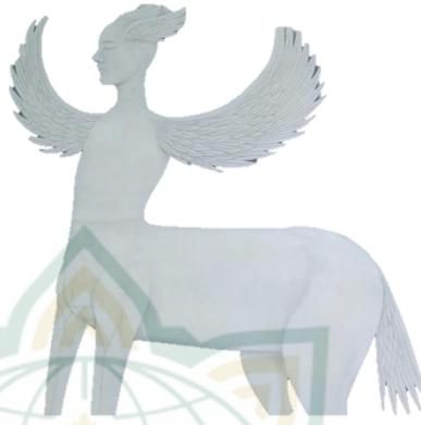
Gambar 4. 6 Capture gambar Buraq yang terdapat dalam lukisan “ Buraq ”

Figur Buraq digambarkan dengan makhluk berkaki empat, berperawakan seperti kuda dan memiliki wajah seperti manusia, berwarna putih serta memiliki sayap diantara kedua kakinya.