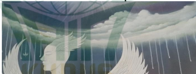
Gambar 4. 9 Capture awan yang terdapat dalam lukisan “Buraq”

Awan digambarkan dengan warna putih dan terdapat warna kekuningan di bagian bawah sebagai efek cahaya.