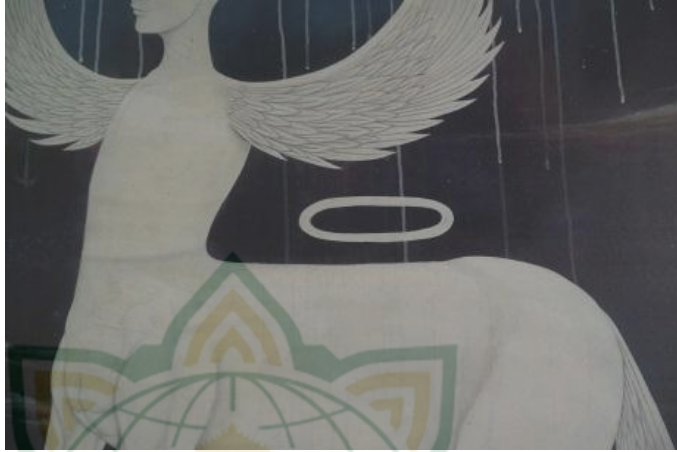
Gambar 4. 11 Capture gambaran lingkaran halo

Lingkaran halo merupakan lingkaran berwarna putih yang terdapat pada bagian atas tubuh Buraq .