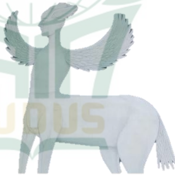
Gambar 4.11. Capture gambar Buraq yang terdapat dalam lukisan “Buraq”

Figur Buraq digambarkan dengan makhluk berkaki empat, berperawakan seperti kuda dan memiliki wajah seperti manusia, berwarna putih serta memiliki sayap diantara kedua kakinya.