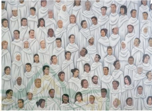
Gambar 4. 10 Capture gambar Orang-orang yang berpakaian serba putih yang terdapat dalam lukisan “Buraq”

Gambaran sekumpulan orang-orang yang berbeda jenis kelamin namun menggunakan pakaian yang serba putih seperti pakaian ihram.