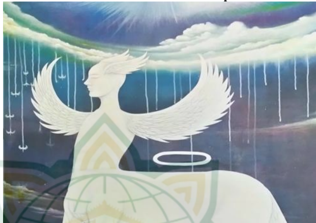
Gambar 4. 8 Capture gambaran langit yang terdapat dalam lukisan “Buraq”

Langit digambarkan dengan warna gradasi dari biru cerah hingga biru keunguan.