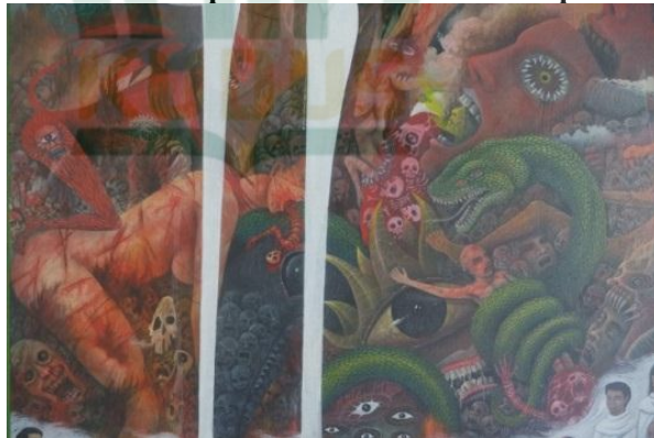
Gambar 4. 7 Capture gambaran penyiksaan yang terdapat dalam lukisan “ Buraq ”

Pada bagian ini digambarkan seekor ular yang melilit tubuh manusia, selain itu juga digambarkan bagian-bagian tubuh yang terdapat luka sayatan, tengkorak manusia dan gambaran penyiksaan lainnya.