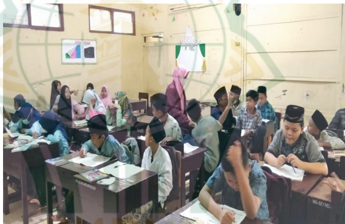
Gambar 4.6 Proses Pengamatan karakter religius siswa pada saat kegiatan belajar mengajar di MTs Nu Mawaqiul Ulum Medini Undaan Kudus 22

Selanjutnya, dari hasil pengamatan selama kegiatan belajar mengajar berlangsung. Dapat diketahui bahwa siswa-siswi memiliki kesadaran sikap serta dapat lebih tenang dalam mengikuti pembelajaran di ruang kelas. Suasana kelas dapat kondusif dan dapat memudahkan siswa-siswi dalam menerima pengetahuan