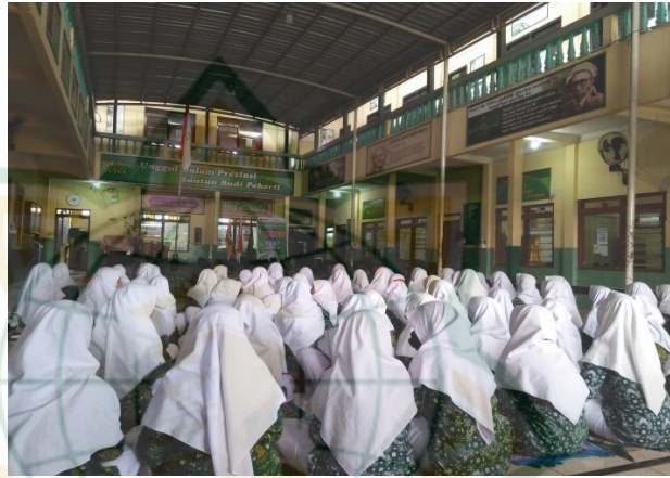
Gambar 4.1 Pembacaan kalimah thoyyibah, asmaul husna dan sholawat sebelum pelaksanaan Sholat Duha 7

Adapun dari hasil observasi peneliti, sebelum proses pembiasaan Sholat Duha ini terlaksana, beberapa guru-guru yang lain juga turut terjun langsung mengawasi siswa-siswi demi terciptanya suasana khidmat seperti yang telah diharapkan madrasah. Selaras dengan hal tersebut, bapak Ahib Yahya selaku waka kurikulum juga turut mengungkapkan: