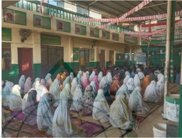
Gambar 4.2 Proses pelaksanaan pembiasaan Sholat Duha di MTs Nu Mawaqiul Ulum Medini Undaan Kudus. 10

Adapun hasil observasi di lapangan, proses pelaksanaan kegiatan ini dimulai jam tujuh tepat, yakni dengan diawali pembacaan kalimah thoyyibah, asmaul husna dan sholawat, setelah itu dilanjut dengan Sholat Duha dua rakaat yang dilaksanakan secara serentak, serta diakhiri dengan pembacaan dosa bersama. Setelah kegiatan tersebut selesai kurang lebih jam setengah delapan maka di lanjut masuk ke kelas masing-masing untuk mengikuti kegiatan pembelajaran.