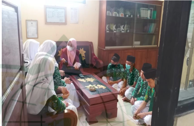
Gambar 4.5 Prosesi wawancara dengan siswa-siswi terkait pembiasaan Sholat Duha di MTs Nu Mawaqiul Ulum Medini Undaan Kudus. 20

Dari hasil observasi dan wawancara diatas, maka dapat diketahui bahwa pembiasaan Sholat Duha di MTs Nu Mawaqiul Ulum Medini Undaan Kudus ini memiliki pengaruh besar terhadap peningkatan karakter religius siswa, karena dengan adanya pembiasaan Sholat Duha ini dapat menggabungkan seluruh aspek dalam hidup siswa, salah satunya yakni aspek sosial. Terbukti dengan bertambahnya pengetahuan agama siswa, mereka dapat mengamalkan sikap yang berkarakter dalam kehidupan keseharian di sekolah, rumah dan lingkungan masyarakat.