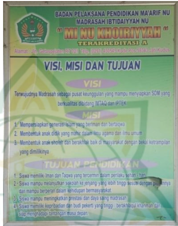
Gambar 4.3 : Visi Misi dan Tujuan MI NU Khiriyyah

VISI : Terwujudnya Madrasah sebagai pusat keunggulan yang mampu menyiapkan SDM yang berkualitas dibidang IMTAQ dan IPTEK