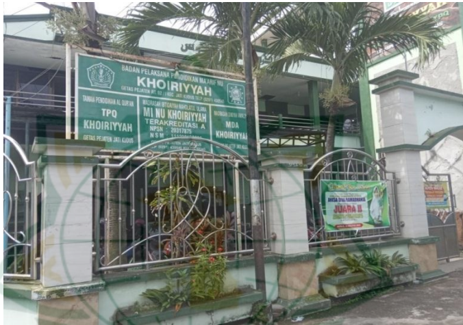
Gambar 4.2 : Tampak samping MI NU Khoiriyyah

Gambar 4.1 : Tampak deapan MI NU Khoiriyyah