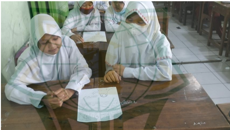
Gambar 4.8 : Diskusi siswa-siswi MI NU Khoiriyah menggunakan media Komik

Siswa diberi kesempatan untuk bertanya dengan menunjuk tangan dan siswa lainya diberi kesempatan jika ingin menanggapi dari pertanyaan-pertanyaan yang telah diajukan, nanti setelah adanya saling jawab antar siswa, peneliti menyampaikan kembali atau menjawabnya dengan meluruskan hasil tanggapan para siswa-siswi.