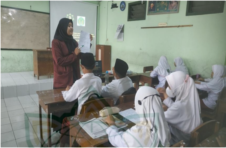
Gambar 4.9 : Proses pembelajaran di dalam kelas menggunakan media Komik