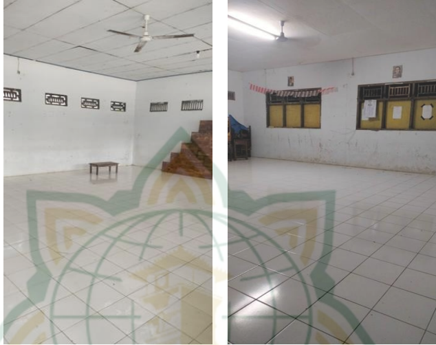
Gambar 4.2 Tempat Pelaksanaan Program Ekstrakurikuler Tahfidz Malam

Dalam pelaksanaannya guru pembimbing menggunakan metode Talaqqi dan wahdah. Dalam wawancara penulis dengan Bapak Abdul Afif S.Pd.I Selaku guru pembimbing tahfidz malam kelas IX menjelaskan bahwa metode talaqqi digunakan untuk murid yang sudah siap menyetorkan hafalannya. Sedangkan metode wahdah bagi murid yang belum siap menyetorkan hafalannya. Bapak Abdul Afif juga memberi pemahaman bahwa metode talaqqi merupakan metode yang sudah biasa digunakan, jadi murid satu persatu menyetorkan hafalan yang baru dihafal kepada guru. Sedangkan metode wahdah adalah membaca berulang ulang halaman atau ayat yang akan dihafalkan setidaknya sepuluh kali. 14