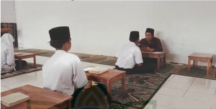
Gambar 4.3 Pelaksanaan Program Ekstrakurikuler Tahfidz Malam