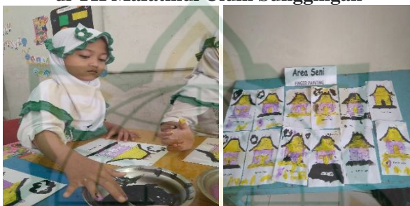
Gambar 4.4 Kegiatan Pembelajaran Finger Painting di TK Mafatihul Ulum Sunggingan

senang dan antusias selama proses pembelajaran finger painting . Pada kreativitas anak di TK Mafatihul Ulum Sunggingan Kudus tentunya berbeda-beda, ada anak yang bagus, ada yang rapi, dan ada pula yang kurang rapi dalam kegiatan finger painting . Hal tersebut yang dapat dilihat pada gambar dokumentasi dibawah ini.