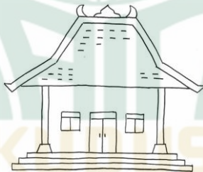
Gambar 4.3 Gambar Sketsa Rumah Joglo

Langkah ketiga berdasarkan hasil penelitian, guru membentuk meja kursi anak untuk duduk dengan posisi secara melingkar dan berhadapan. Serta guru membagikan alat dan bahan untuk kegiatan finger painting yaitu membagikan kertas HVS A4 yang sudah terdapat sketsa rumah joglo dan memberikan cat warna yang ada di piring