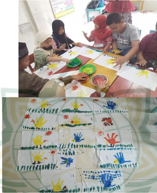
Gambar 4.9 Hasil Finger Painting TK Mafatihul Ulum Sunggingan Kudus