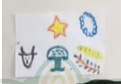
Gambar 4.6 Contoh Finger Painting Hasil Guru

Kegiatan finger painting berjalan dengan baik walaupun setiap kegiatan anak-anak gaduh pada saat antri bergantian dalam pengambilan warna. Berdasarkan hasil observasi selama kegiatan finger painting guru selalu membimbing anak dalam menyelesaikan tugasnya sesuai temanya misalnya salah satu dasar negara yaitu bintang. Ada anak yang membuat bintang belum sempurna, dan kemudian anak meminta bantuan kepada guru untuk menyempurnakan dengan cara guru mengarahkan tangan anak. Dan ada juga anak yang percaya diri apa yang ia hasilkan sesuai kreativitas mereka. 17