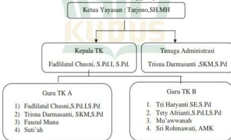
Gambar 4.2 Struktur Kepengurusan TK Mafatihul Ulum Sunggingan Kudus 7