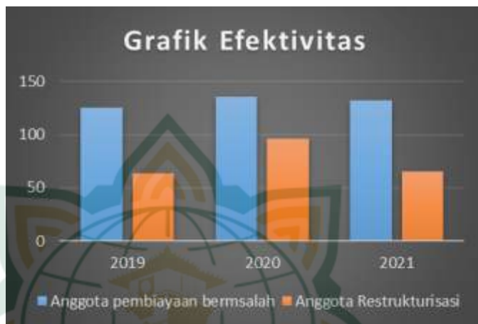
Gambar 4.3 Grafik Efektivitas Program Restrukturisasi Pembiayaan Bermasalah

Berdasarkan dari gambar di atas dapat dilihat restrukturisasi yang dijalankan di BMT Mubarakah Kudus dinilai cukup efektif untuk membantu BMT dalam mewujudkan tujuannya, yang dimana tujuan dari BMT adalah untuk menolong anggota dalam memenuhi kewajibannya yang sempat terkendala masalah pada proses pembayaran angsuran. Dimana yang awalnya pembiayaan dari anggota tersebut termasuk kategori masalah setelah dilakukannya restrukturisasi pembiayaan tersebut menjadi lebih baik dan anggota kembali lancar dalam melunasi angsurannya kepada BMT Mubarakah. Hal ini dilakukan restrukturisasi bertujuan untuk menjaga kualitas pembiayaan yang dilakukan oleh anggota dan berdampak pada tingkat kesehatan BMT. Maka dari itu dalam menjalankan restrukturisasi harus di sertai dengan pengawasan dan penjagaan yang lebih ketat lagi supaya tidak terjadinya gagal restrukturisasi dan hal hal yang tidak terduga lainnya.