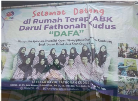
Gambar 4.2 Visi Rumah Terapi

Mengantar generasi mandiri guna mengoptimalkan tumbuh kembang anak sesuai bakat dan kecerdasan nya.