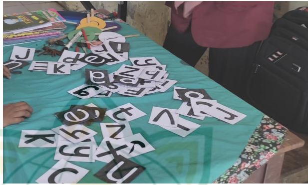
Gambar 4.2. Media Kartu Huruf

Kemudian guru menjelaskan kepada peserta didik cara membunyikan huruf-huruf tersebut. Peserta didik menyimak penjelasan guru sambil ikut membunyikan bunyi huruf yang dibunyikan oleh guru. Kemudian guru melafalkan bunyi huruf tanpa menunjukkan kartu huruf dan peserta didik diminta membunyikan huruf-huruf tersebut tanpa melihat contoh.