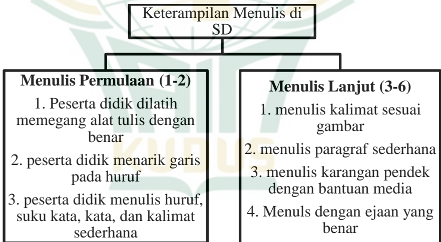
Gambar 2.2. Keterampilan Menulis di SD. 47

Pencapaian dalam standar kompetensi pembelajaran menulis pada mata pelajaran bahasa Indonesia, peserta didik diharapkan dapat menulis permulaan melalui kegiatan dikte dengan menebalkan, menjiplak, melengkapi, mencontoh, dan menyalin huruf tegak bersambung. Selain