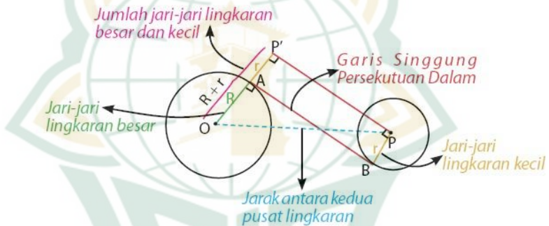
Gambar 2.2 garis singgung persekutuan dalam lingkaran

Perhatikan bahwa segitiga PP'O merupakan segitiga siku-siku yang siku-siku di P' , dengan teorema pythagoras dapat diperoleh panjang PP' yaitu sebagai berikut: