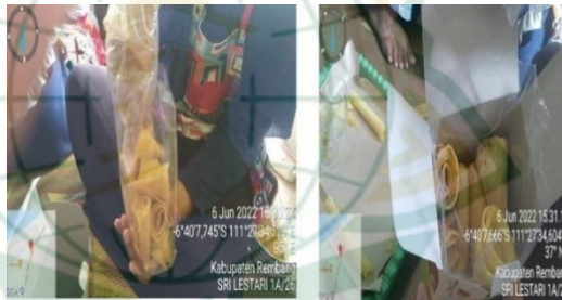
Gambar 4.12 Pengemasan

Langkah ketujuh, pengemasan. Setelah dingin selanjutnya siap dikemas dalam plastik dan dimasukkan kedalam kardus dan produk siap dipasarkan.