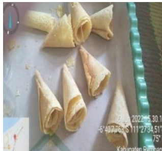
Gambar 4.11 Proses Pendinginan

Langkah ketujuh, pengemasan. Setelah dingin selanjutnya siap dikemas dalam plastik dan dimasukkan kedalam kardus dan produk siap dipasarkan.