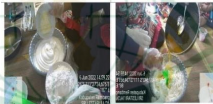
Gambar 4.9 Proses Pencampuran Semua Bahan

Langkah kelima, pencetakan. Apabila sudah tercampur rata, adonan bisa siap dicetak dengan menuangkan adonan sesendok demi sesendok pada cetakan. Kemudian digulung dengan bantuan alat.