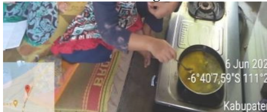
Gambar 4.8 Mentega Dilelehkan

Langkah keempat, mencampurkan bahan hingga rata. campurkan langkah kedua dan ketiga sedikit-demi sedikit ke langkah pertama secara bergantian, sambil diaduk dengan kecepatan sedang atau rendah hingga tercampur rata.