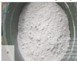
Gambar 4.3 Foto Tepung Mocaf

Modified Cassava Flour atau yang sering disebut tepung mocaf ini merupakan salah satu produk unggulan ubi kayu atau singkong. Tepung mocaf merupakan tepung yang terbuat dari singkong. Singkong tersebut diproduksi secara mikrobiawi, sehingga menghasilkan tepung mocaf yang berkualitas yang tidak berbau singkong, tepung lebih halus dan putih, serta lebih tahan lama dibanding tepung singkong biasa atau gapek. Tepung mocaf dapat digunakan sebagai pengganti terigu atau tergantung jenis produknya.