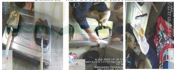
Gambar 4.10 Proses Pencetakan

Langkah keenam, pendinginan. Sebelum masuk ke tahap pengemasan sebaiknya didinginkan terlebih dahulu agar tidak mengembun saat dikemas dalam plastik.