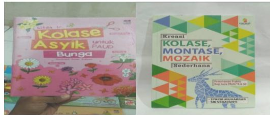
Gambar 4.8 Contoh buku referensi bertema kolase di TK Nurul Ilmi Jati Kudus

Dari hasil observasi yang diperoleh oleh peneliti, maka dapat dipahami bahwa banyak pedoman yang dapat dijadikan seorang guru sebagai acuan dalam kegiatan membuat kolase dalam pembelajaran, yakni buku-buku referensi yang ada di sekolah, pelatihan atau workshop yang diikuti oleh guru dari lembaga sekolah, serta penggunaan media internet. 16