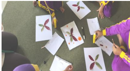
Gambar 4.3 Kegiatan Kolase Kegiatan Kolase pada Tanggal 1 September 2021