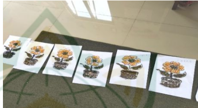
Gambar 4.2 Hasil Karya Kegiatan Kolase pada Tanggal 30 Agustus 2021

Penelitian dilakukan pada hari Rabu, 30 Agustus 2021. Adapun kegiatan yang dilakukan pada hari itu adalah: