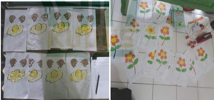
Gambar 4.11 Hasil Kegiatan Kolase Menggunakan Bahan Alam di TK Nurul Ilmi Jati Kudus

Hasil Observasi yang dilakukan oleh peneliti, bahwa keterampilan motorik halus anak dapat dilihat dari hasil karya kolase bahan alam yang telah dibuat oleh anak. Anak dengan perkembangan motorik halus yang bagus, mampu menyelesaikan tugas kolase tersebut dengan baik dan sesuai harapan. Namun demikian, bagi anak yang perkembangan motoriknya belum bagus, maka hasilnya pun juga belum sesuai harapan. Dalam hal ini, tugas guru adalah memberikan respon atau timbal balik terhadap karya yang telah dibuat anak. Respon yang diberikan dapat berupa pujian sebagai bentuk reward pada anak atas apa yang mereka capai, atau dapat berupa motivasi kepada anak agar mereka lebih bersemangat lagi. Oleh karena itu, ketika anak-anak belajar dari rumah guru harus lebih aktif menjalin komunikasi dengan anak melalui orang tuanya. Hal ini diperkuat dengan hasil karya anak melalui kegiatan kolase berbahan alam.