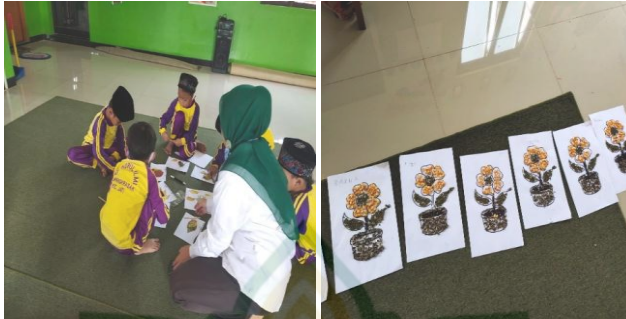
Gambar 4.12 Kegiatan permainan Kolase pada aspek Menggambar serta Menempel pada anak kelompok B di TK Nurul Ilmi Jati Kudus

Dari berbagai tehnik pengumpulan data di atas, dapat disimpulkan bahwa upaya meningkatkan kemampuan motorik halus dalam aspek ketelitian melalui permainan kolase bagi anak kelompok B di TK Nurul Ilmi Jati Kudus tahun pelajaran 2021 dilakukan melalui pembelajaran yang menyenangkan dengan menitikberatkan pada keterampilan anak dalam menggunakan jari jemari, melatih koordinasi mata dan tangan, membiasakan memiliki kecermatan dalam menempel dan memberi lem, dan membiasakan memiliki kerapian dalam menyelesaikan hasil karyanya. 35