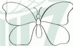
Gambar 4.4 Skema Gambar Kupu-kupu

Pada kegiatan menempel teknik kolase ini berlangsung sekitar 30 menit, murid bebas memilih warna sesuai dengan keinginan dan kreativitas mereka. Murid diberikan masing-masing satu buah lem agar tidak saling mengganggu dan saling berebut. Saat berjalanya kegiatan berlangsung tidak sedikit siswa yang mulai membuat gaduh di kelas, seperti siswa mengambil lem dan daun yang sudah disediakan oleh guru padahal guru sudah menyiapkan dan membagikan satu per satu kepada siswa. Kemudian salah satu murid ada yang bertengkar dan menangis gara-gara bermain lem ditempelkan di badan temannya. Berikut ini adalah hasil karya siswa pada kegiatan kolase bahan alam dengan tema Binatang/Darat/Kupu-kupu.