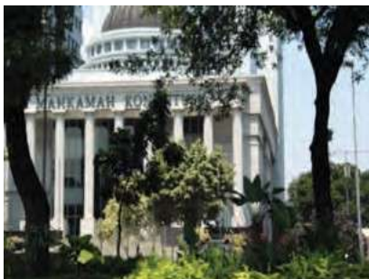
Gambar 4.1 tentang lembaga negara yakni Mahkamah Konstitusi (MK)

Hasil pengamatan dan pembacaan pada buku bacaan pendidikan agama Islam dan budi pekerti kelas X – XII SMA menunjukkan bahwa ada delapan gambar yang merepresentasikan nilai-nilai kejujuran.