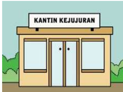
Gambar 4.6 tentang kantin kejujuran di sekolah

Kejujuran juga harus diterapkan di dunia pendidikan. Dalam hal ini, salah satu sikap jujur adalah mendirikan kantin kejujuran. Hal ini dapat dijumpai pada buku bacaan pendidikan agama Islam dan budi pekerti kelas XI halaman 20. Gambar 4.6 terlihat bahwa sebuah bangunan bertuliskan kantin kejujuran disertai samping kiri dan kanannya ada semak-semak. Dapat diungkap bahwasanya kantin kejujuran terletak dalam suasana sejuk. Hal ini dapat membuat pembeli nyaman dan berlama-lama di kantin kejujuran. Kantin kejujuran merupakan fenomena nyata di dunia pendidikan. Beberapa penelitian memotret tentang kantin kejujuran diantaranya yakni penelitian pertama dari Lazuardi Fajar Nur Rahmansyah berjudul Upaya Mewujudkan Nilai-Nilai Kejujuran Siswa Melalui Kantin Kejujuran di SMP Negeri 7 Semarang 14 dan penelitian kedua dari Intan Suci yang berjudul Implementasi Kantin Kejujuran dalam Upaya Menanamkan Sikap Jujur dan Tanggung Jawab Siswa SMK N 1 Salatiga Tahun Ajaran 2017/2018 . 15 Oleh karena itu, dalam buku teks ini terdapat pembelajaran bahwa lokasi kantin kejujuran harus sejuk, agar pembeli bisa nyaman berlama-lama dan sangat penting adanya karena