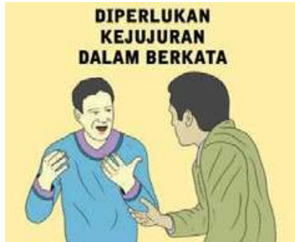
Gambar 4.7 tentang jujur dalam setiap perkataan

untuk membiasakan peserta didik untuk mempunyai karakter jujur.