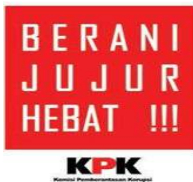
Gambar 4.5 tentang slogan ajakan untuk berani jujur

adalah tindakan suap. Hal ini dapat dilihat pada buku bacaan pendidikan agama Islam dan budi pekerti kelas X halaman 107. Gambar 4.4 terlihat bahwa seseorang sedang memasukkan beberapa lembar uang euro ke dalam jas seseorang secara diam-diam. Dapat diartikan bahwasanya memasukkan atau menerima uang secara diam-diam untuk melancarkan sebuah tujuan besar merupakan kegiatan suap menyuap. Suap merupakan salah satu fenomena nyata di dunia perkantoran. Beberapa penelitian memotret tentang suap diantaranya yakni penelitian pertama dari M Miss Tesar S berjudul Tinjauan hukum Islam terhadap Tindak Pidana Suap di Indonesia 10 dan penelitian kedua dari Oka Hendra Wismoyo yang berjudul Pertanggungjawaban Pidana Pemberi dan Penerima Suap Serta Upaya Penanggulangan Terjadinya Suap. 11 Oleh karena itu, dalam buku teks ini terdapat pembelajaran bahwa menerima atau memasukkan uang dengan dasar melancarkan tujuannya merupakan perbuatan suap, yakni perbuatan yang salah dan pelakunya dapat di penjara.