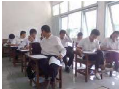
Gambar 4.3 tentang mencontek di kelas saat ujian