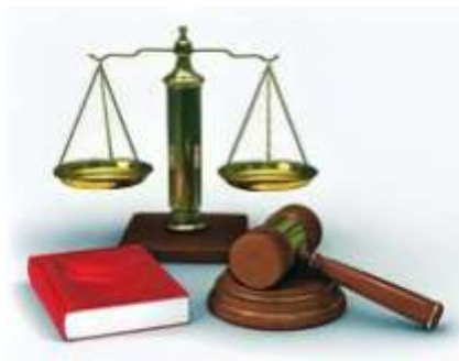
Gambar 4.8 tentang pengadilan

Melalui Mata Pelajaran Sosiologi Kelas X di MAN Bangil Pasuruan. 17 Oleh karena itu, dalam buku teks ini terdapat pembelajaran bahwa setiap perkataan yang keluar dari mulut saat mengobrol serius harus disertai ucapan jujur atau dalam Islam dikenal dengan istilah sidiq . Jika ucapannya bohong, maka hilang sudah kepercayaan terhadap lawan bicara.