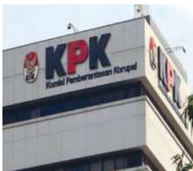
Gambar 4.2 tentang lembaga negara Komisi Pemberantasan Korupsi (KPK)

yang berjudul Implementasi Putusan Mahkamah Konstitusi Yang Konstitusional Bersyarat (Studi Terhadap Putusan Mahkamah Konstitusi Nomor 97/PUU-XIV/2016). 5 Oleh karena itu, dalam buku teks ini terdapat pembelajaran bahwa dalam memutuskan sengketa perkara yang melibatkan lembaga negara (MK) harus didasari dengan cara keadilan dan kejujuran walaupun terdapat banyak hal rintangan.