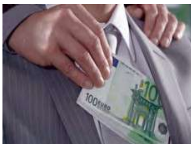
Gambar 4.4 tentang perbuatan suap di lingkungan kantor Kejujuran juga harus diterapkan di dalam kantor. Dalam konteks dunia kantor, salah satu sikap tidak jujur

yang di depan sedang mencontek ke belakang, sedangkan siswa yang disampingnya mengerjakan ulangan sendiri. Dapat diartikan mencontek disebabkan karena tidak percaya pada diri sendiri, sedangkan mengerjakan ulangan sendiri mempunyai rasa percaya diri tinggi. Mencontek merupakan salah satu fenomena nyata di dunia pendidikan. Beberapa penelitian memotret tentang mencontek diantaranya yakni penelitian pertama dari Yoseph Dedy Charismawan berjudul Perilaku Siswa Terhadap Menyontek Ditinjau Dari Akreditasi dan Tingkat Pendidikan Orang Tua Pada Siswa Kelas VIII di Kota Yogyakarta 8 dan penelitian kedua dari Titi Kharisma Prihatiningtyas yang berjudul Perilaku Menyontek Ditinjau dari Konsep Diri dan Efikasi Diri Pada Siswa Kelas X SMA Negeri X . 9 Oleh karena itu, dalam buku teks ini terdapat pembelajaran bahwa mencontek merupakan perbuatan yang curang dan tidak punya rasa percaya terhadap diri sendiri saat mengerjakan ulangan di kelas.