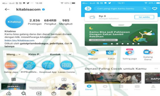
Gambar 2.3 (Tampilan Beranda Pada Website Dan Instagram Kitabisa.Com)