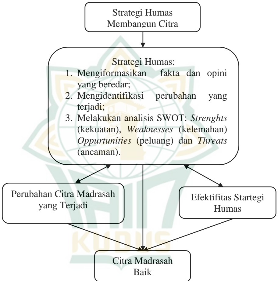
Gambar 2.2 Kerangka Berpikir

Strategi penempatan misi organisasi atau lembaga adalah penempatan tujuan organisasi dengan mempertimbangkan kekuatan internal dan eksternal, merumuskan kebijakan dan teknik tertentu untuk mencapai tujuan dan memastikan pelaksanaannya tepat sehingga tujuan dan sasaran utama organisasi atau lembaga dapat tercapai.