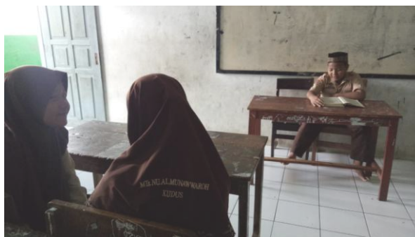
Gambar 4.7 Kegiatan AKSI

AKSI adalah kegiatan ajang menampilkan bakat, kreatifitas dan kemampuan peserta didik dalam menyampaikan materi berupa pidato, puisi, materi pelajaran, qiro'atul qur'an, tahlil dan lainnya. Kegiatan ini dilakukan setiap hari kamis di kelas masing-masing dimulai pukul 07.00-07.20 WIB di kelas dengan didampingi oleh guru mata pelajaran jam pertama dan wakil kelas pendamping. Dari kegiatan ini peserta didik diharapkan menjadi generasi yang siap tampil di depan publik dengan menunjukkan segala potensi yang dimiliki. Tujuan dari kegiatan tersebut agar Peserta didik lebih percaya diri, kreatif, inovatif, terampil dan komunikatif.