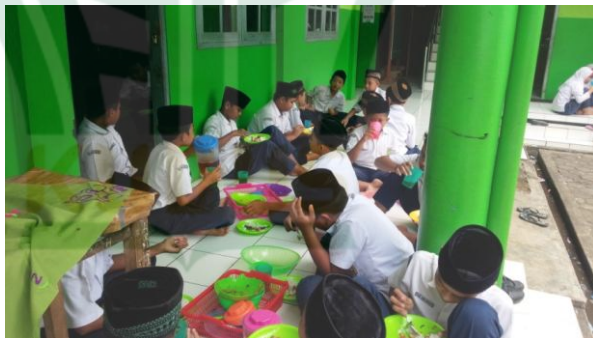
Gambar 4.8 Makan Bersama

Tujuan dari kegiatan tersebut adalah Meningkatkan kekompakan, kebersamaan dan kedisiplinan peserta didik. Melatih sifat rajin dan kerja keras peserta didik. Memberikan konsumsi makanan sehat peserta didik.