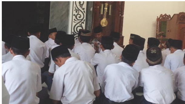
Gambar 4.5 Pembacaan tahlil bersama

Tahlil bersama merupakan kegiatan membaca Tahlil bersama sebagai Amaliyah Ahlussunnah Wal Jamaah yang dilaksanakan peserta didik MTs NU Al Munawwaroh untuk mengirim doa kepada ahli kubur, para guru dan masyayikh. Kegiatan ini dilaksanakan setiap hari rabu usai melaksanakan kegiatan sholat dhuha berjamaah pukul 07.00 hingga 07.20 WIB di Masjid Al Munawwaroh.