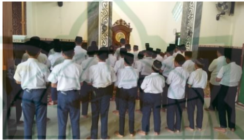
Gambar 4.3 Sholat Dhuha berjamaah

Dengan membiasakan shalat dhuha memberi dampak yang sangat positif pada siswa, dan menurut pengamatan penulis, siswa tersebut memiliki sikap dan perangai yang sangat baik, bahkan dalam segi akademik yang bersangkutan selalu berprestasi.