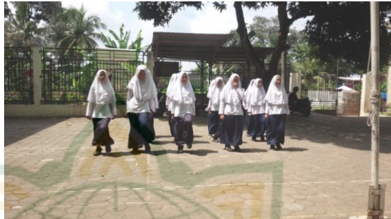
Gambar 4.9 Latihan Protokoler

Begitu juga program-program rutin sudah dirancang dengan baik untuk mendukung tercapainya visi, menyesuaikan antara teori dengan keadaan langsung di MTs NU Al Munawwaroh bahwa mereka memiliki kegiatan-kegiatan Ekstrakurikuler di MTs NU Al Munawwaroh. Ekstrakurikuler adalah kegiatan siswa/siswi di luar jam pelajaran (tatap muka) dengan maksud untuk lebih memperkaya dan memperluas wawasan pengetahuan dan kemampuan yang telah dimiliki serta untuk menambah keterampilan para siswa. Ekstrakurikuler yang ada di MTs NU Al Munawwaroh adalah sebagai berikut: