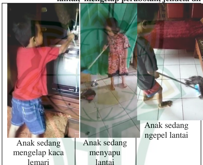
Gambar 4.3 Hasil pelaksanaan kegiatan menyapu lantai, mengelap perabotan, jendela dll

Kegiatan menyapu lantai, mengelap perabotan, jendela dll, ini diperkuat dengan hasil dokumentasi kegiatan daring.