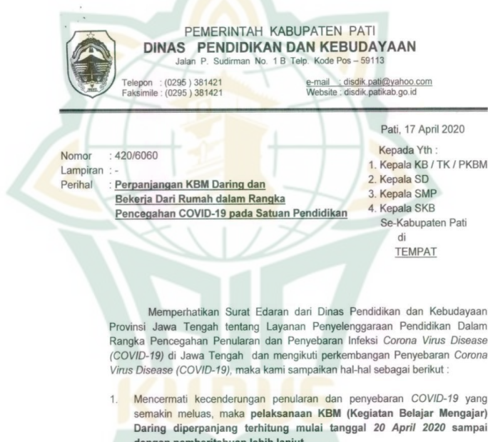
Gambar 4. 1 Surat Perihal Perpanjangan KBM Daring dan Bekerja dari Rumah

kebudayaan provinsi Jawa tengah yang mengatakan bahwa pelaksanaan kegiatan belajar mengajar dilakukan secara daring. Berikut gambar surat edaran yang ditunjukkan atau diperlihatkan oleh Ibu U kepada peneliti.