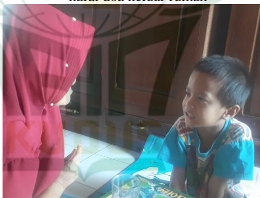
Hasil pelaksanaan kegiatan anak sedang meniru membaca doa keluar rumah, menggunakan metode pembiasaan dengan cara diulang-ulang

Di TK Masyithah ada kegiatan pembiasaan untuk melatih membentuk akhlak