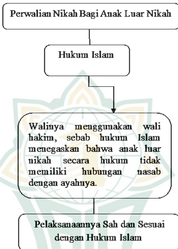
Gambar 2.1 Skema Kerangka Berpikir