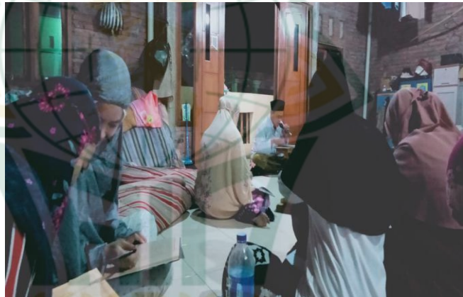
Gambar. 4.4 Sesi Tanya Jawab

Pernyataan tersebut dapat menjelaskan bahwa dalam sesi tanya jawab Ustaz atau Ustazah memberikan ruang bagi santri untuk menyuarakan apa yang mereka pahami dari penyampaian Ustaz atau Ustazah, dan hal ini juga bertujuan untuk mengajak santri untuk mengkritisi segala materi yang dipelajari baik faham atau tidak faham, sehingga difikir dan