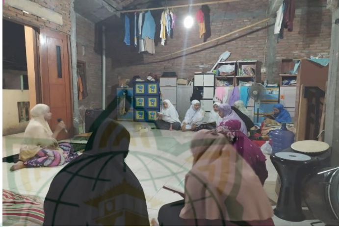
Gambar 4.5 Foto Mengaji Al-Qur'an

Peneliti mengamati banyak santri yang antusias untuk mengikuti kegiatan mengaji Al-Qur'an, baik bagi yang Bin Nadzhor maupun Bil Ghoib , selain untuk mentaati tata tertib santri merasa adanya kenyamanan di hati setelah mengaji Al-Qur'an. Hal semacam ini adalah pendidikan rohani yang terus ia pelajari sehingga menjadikan lambat laun mengubah akhlaknya santri menjadi pribadi yang berakhlakul karimah sesuai nilai-nilai isi al-Qur'an yang mereka pelajari. 18