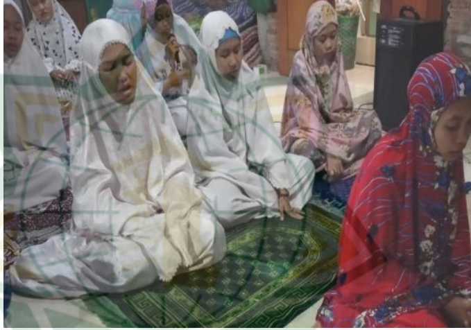
Gambar 4.8 Membaca Asma'ul Husna

Pemaparan tersebut dapat menjelaskan bahwa santri asrama Abah Rozaq selalu mengikuti kegiatan membaca asma'ul husna , Walaupun ditengah malam hari santri tetap antusias mengikuti rutinitas membaca asma'ul husna , sebagian ada yang menahan rasa kantuknya. Dengan adanya kegiatan semacam ini menjadikan secara perlahan rohaniahnya tergugah secara perlahan untuk selalu istiqomah menjalankan ibadah, sehingga berjalannya waktu menjadikan kegiatan-kegiatan semacam ini sudah melekat pada diri santri dan bisa tertanamkan dalam pribadinya baik dari hati maupun prilakunya sesuai dengan syari'at-syari'at islam.