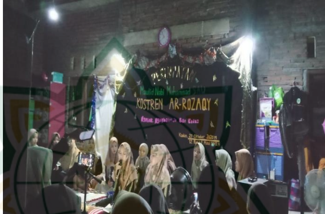
Gambar 4.6 foto dziba'iyah

Peneliti mengamati santri sangat antusias sekali mengikuti kegiatan ziba'iyah , selain bersolawat kepada kanjeng nabi kegiatan ziba'iyah ini merupakan suatu kegiatan liburan para santri karena adanya fasilitas alat hadroh yang memadai sehingga santri sangat antusias sekali mengikuti kegiatan ziba'iyah . 20