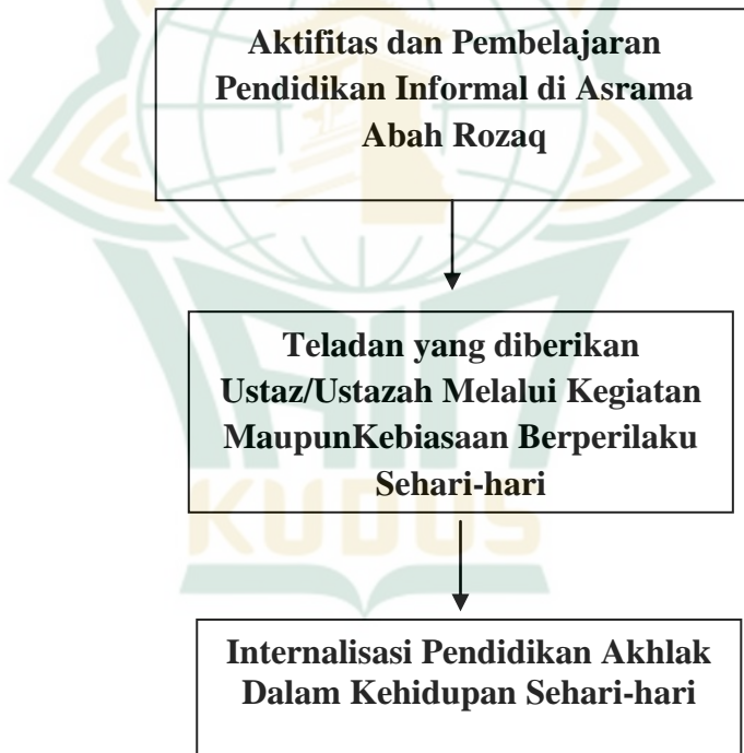
Gambar 2.1 Kerangka Berpikir Implementasi Pendidikan Informal Berbasis Akhlak Di Asrama Abah Rozaq Ngetuk Ngembal Rejo Kudus

istighostah, keteladanan, dan pembiasaan berbuat baik. Sehingga membentuk santriwati yang cerdas, ber-akhlakul karimah Kepada Allah SWT, kepada sesama manusia, kepada keluarga, kepada lingkungan sekitar, dan bahkan terhadap diri sendiri. Sehingga Kerangka Berpikir dalam penelitian ini, dapat digambarkan pada Gambar 2.1 sebagai berikut