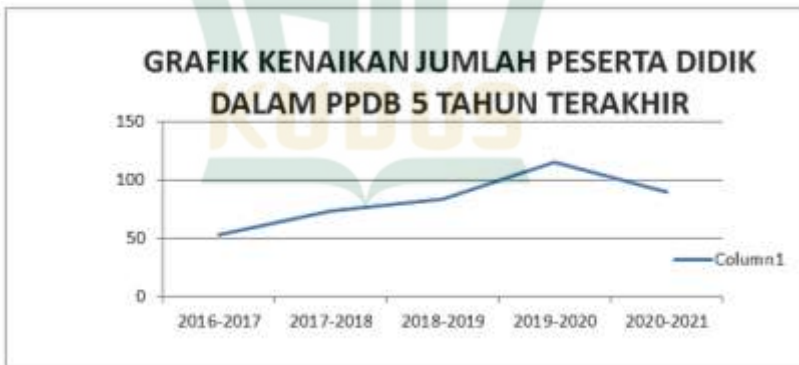
Grafik Proses Ke PPDB Kenaikan Animo Masyarakat Untuk Bersekolah di MIN 1 Pati

Dari data diatas tentang PPDB selama 5 tahun terakhir, MIN 1 Pati mengalami banyak kenaikan jumlah peserta didik dikarenakan manajemen PPDB yang baik mulai dari tahap Perencanaan, Pengorganisasian,