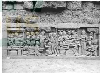
Gambar 2.2 Relief Candi Borobudur

Komik modern di Indonesia mulai bermunculan pada era 1930-an dengan menggunakan bahasa Melayu-Cina. Komik Put On karya Kho Wang Gie (Sopoiku) yang merupakan jenis komik strip biasanya dimuat pada majalah mingguan Sin Po pada 1931-