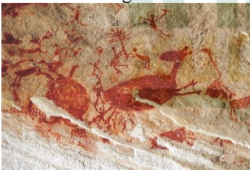
Gambar 2.1 Lukisan Dinding Goa

Selain relief pada candi Prambanan dan Borobudur, cikal bakal komik di Indonesia juga dibuktikan dengan keberadaan wayang beber. Wayang beber merupakan cerita wayang yang digambarkan diatas kain maupun kertas dengan pelukisannya menggunakan cat yang dipanel dalam setiap adegan dan saling berurutan. Keberadaan wayang beber bertujuan untuk memberikan informasi kepada masyarakat. Candi dan wayang beber memiliki persamaan yakni penggunaan media visual gambar tanpa menggunakan teks. Perbedaan candi dan wayang terletak pada media penggambarannya. Pada candi Borobudur maupun candi lainnya menggunakan batu yang dipahat sebagai medianya, sedangkan pada wayang beber menggunakan kertas maupun daun kering.