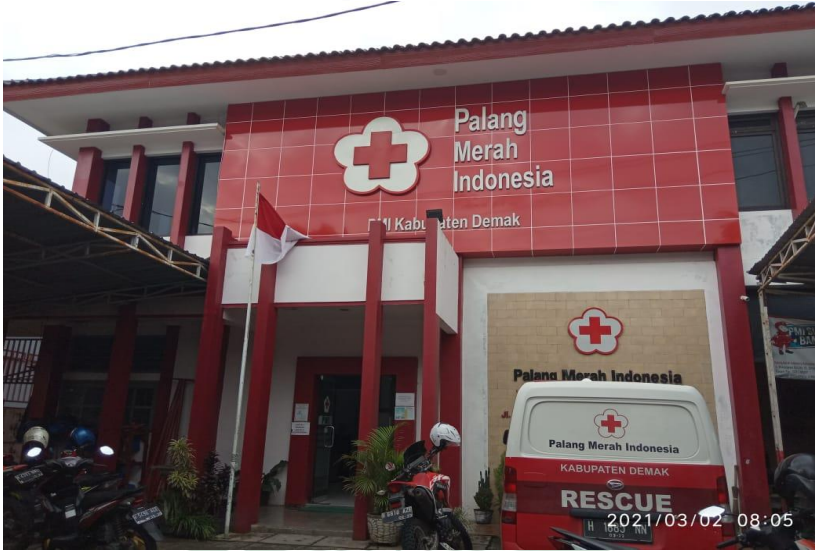
Gambar 1. Markas PMI Kabupaten Demak