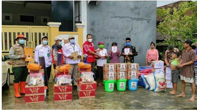
Gambar 4. Kegiatan pendistribusian bantuan kepada korban bencana kebakaran rumah

Di PMI Kabupaten Demak dalam mendiseminasikan Kepalangmerahan menggunakan 2 metode diseminasi yaitu metode diseminasi advokasi/promosi dan metode orientasi atau pelatihan. Dalam metode advokasi/promosi yang dilakukan oleh PMI Kabupaten Demak yaitu melakukan pelayanan kesehatan dan seperti peringatan hari HIV dan AIDS. 17