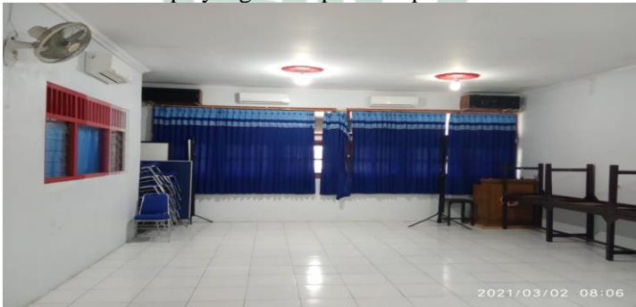
Gambar 5. Ruang Aula PMI Kabupaten Demak

Pada pelaksanaan diseminasi Kepalangmerahan beberapa fasilitas ruang tersebut memang diperlukan untuk mendukung implementasi diseminasi. Seperti ruang aula untuk tempat pelatihan. Fasilitas selanjutnya dalam pelatihan diseminasi yang juga diperlukan adalah media untuk praktek. Dalam sebuah pelatihan tidak hanya materi yang disampaikan tetapi juga cara untuk pengaplikasiannya agar peserta lebih memahami apa yang disampaikan oleh pelatih.