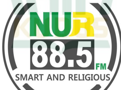
Gambar 4.1 Logo PT Radio Nahdloh – Radio Nur FM Rembang