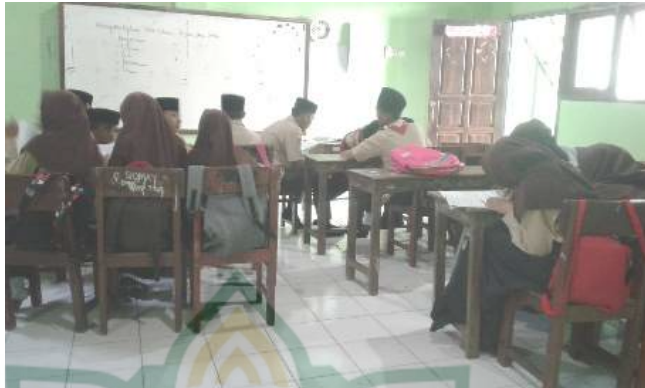
Gambar 4.5 Proses diskusi untuk presentasi

Sedangkan dari observasi yang dilakukan peneliti pada saat itu guru SKI melakukan penilaian kinerja, guru SKI juga memberikan tugas kepada peserta didik dibagi menjadi beberapa kelompok untuk mempresentasikan materi tentang ulama ahli fikih dalam kemajuan kebudayaan/ peradaban islam pada masa dinasti abasiyah, aspek yang dinilai mulai dari keberanian peserta didik dalam mempresentasikan materi, kebenaran konsep, serta kelancaran bahasanya . 22