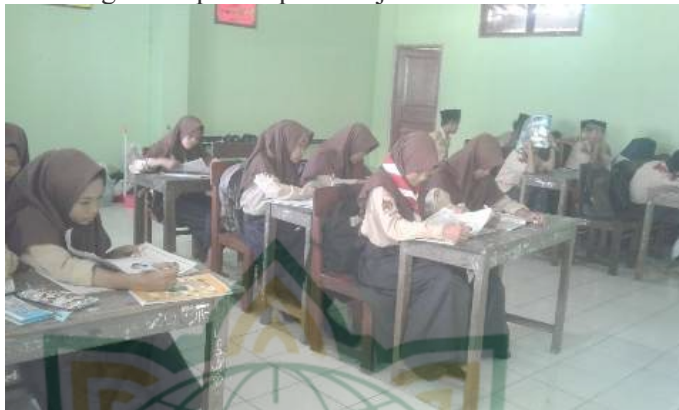
Gambar 4.1 Proses Pembelajaran SKI

Berikut gambar proses pembelajaran SKI di kelas VIII