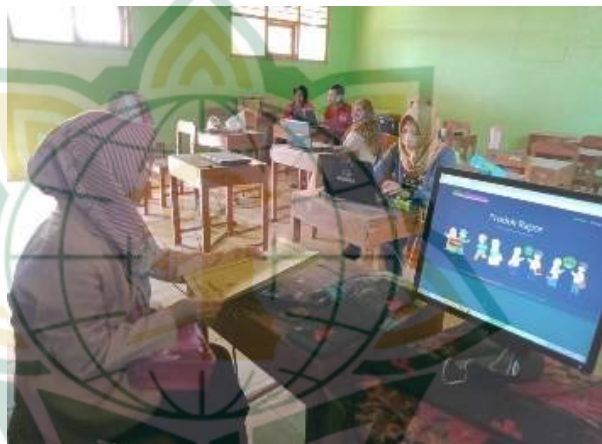
Gambar 4.5 guru melakukan pengolahan nilai raport

selain itu kehadiran peserta didik dimaksudkan untuk membangun komunikasi antar pihak sekolah dengan orang tua peserta didik. Hal biasanya yang disampaikan adalah masalah-masalah yang dihadapi anak dalam proses pembelajaran maupun luar pembelajaran sehingga orang tua agar lebih memperhatikan dan mengontrol anaknya dirumah”. 24