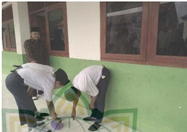
Gambar 4.3 Para siswa mengambil sampah yang berserakan dilantai

Berdasarkan observasi dan dokumentasi yang dilakukan peneliti bahwa penilaian sikap dalam bentuk observasi yang dilakukan guru dalam mengamati sikap dan kebiasaan peserta didik dalam kehidupan sehari-hari dalam sekolah. Dan membuahkan hasil yang baik KI-2 (gambar 4.1 dan gambar 4.2) walau kadang masih ada peserta didik berperilaku kurang baik seperti tidak menyapa guru, mencontek. 17