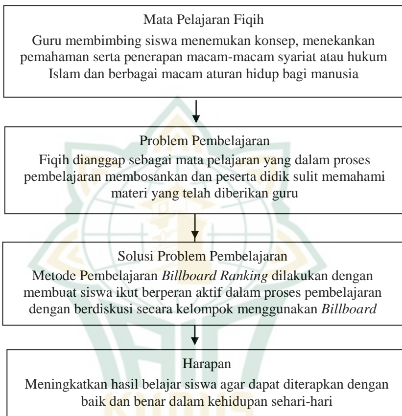
Gambar 2.2 Kerangka Berpikir