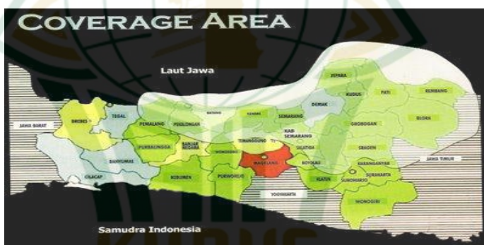
Gambar 4.2 Peta Coverage Area

Daerah cakupan ( coverage area ) pancaran TVKU Semarang cukup menjangkau hampir sebagian besar kota – kota di Jawa Tengah, yaitu meliputi: Semarang, Demak, Kudus, Pati, Rembang, Blora, Jepara, Purwodadi, Ungaran, Salatiga, Boyolali, Kendal, Weleri, Batang, Pekalongan, Pemalang, Sragen, Surakarta, Karanganyar, Sukoharjo, Temanggung, dan Magelang. 3