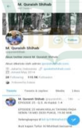
Gambar 3. Laman Twitter M. Quraish