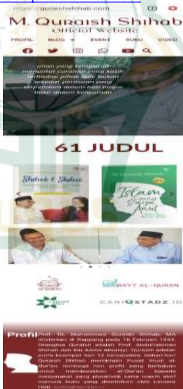
Gambar 1. Laman Website M. Quraish S.