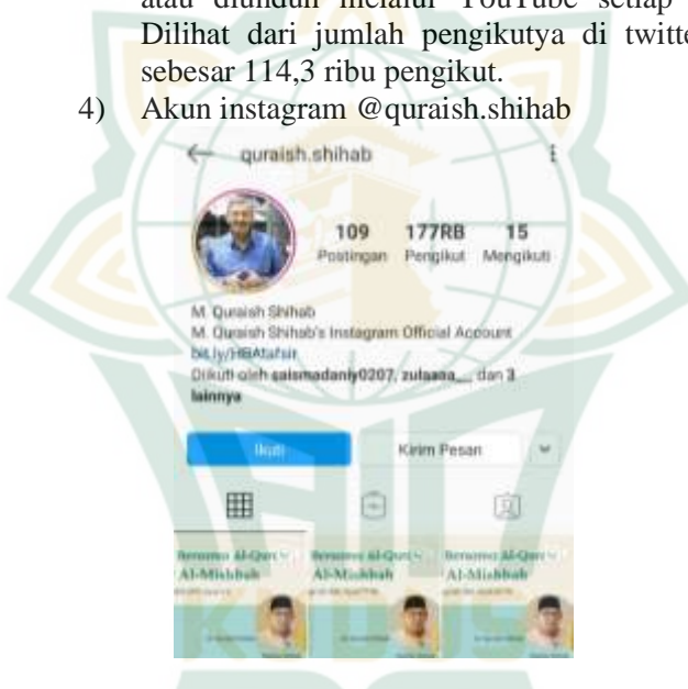
Gambar 4. Fanspage Facebook M. Quraish S.

Sama halnya dengan twitter , akun instagram MQS tertaut dengan akun twitter nya. Jadi hasil unggahan yang ada di twitter dengan yang ada di instagram kurang lebih adalah sama. Akun tersebut sudah diikuti oleh 169 ribu pengikut yang aktif di instagram . Dan tidak sedikit juga para viewer yang aktif untuk merespon konten tersebut.