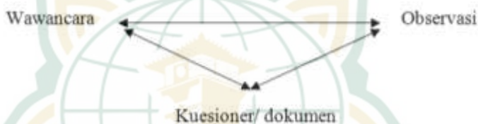
Gambar 3.2. Triangulasi Dengan Tiga Teknik Pengumpulan Data

peserta didik dilakukan dengan cara mengecek data kepada sumber yang sama dengan teknik yang berbeda. Misalnya data diperoleh dengan wawancara. lalu dicek dengan observasi. dokumentasi. atau kuesioner. Bila dengan teknik pengujian kredibilitas data tersebut, menghasilkan data yang berbeda-beda maka peneliti melakukan diskusi lebih lanjut kepada sumber data yang bersangkutan atau yang lain untuk memastikan data mana yang dianggap benar atau mungkin semuanya benar, karena sudut pandangnya berbeda-beda. Pengujian triangulasi teknik yang dilaksanakan sebagaimana gambar berikut: