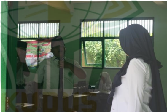
Gambar 4.8 Guru Sedang Mendisiplinkan Siswa

Pada gambar 4.8 terlihat guru sedang mendisiplinkan siswa untuk segera menuju ke masjid. Dalam mendisiplinkan siswa, guru melakukan pendekatan secara personal. Hal ini dilakukan guna memberikan perhatian lebih kepada siswa supaya segera menuju ke masjid. Dalam mendisiplinkan siswa terdapat kendala hal ini terjadi karena pada dasarnya karakter siswa beragam, contoh terdapat siswa yang ketika siswa tersebut diberi ketegasan siswa tersebut kemudian lari menghindar atau bahkan melawan ada pula siswa yang dirayu dengan cara halus kemudian