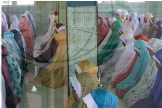
Gambar 4.4 Para Siswi Sedang Melaksanakan Sholat Dhuhur Berjamaah

Pada Gambar 4.4 tampak sholat dhuhur berjamaah berlangsung dengan tertib dan khidmat. Hal ini tidak lepas dari usaha bapak ibu guru yang senantiasa membimbing dengan sepenuh hati dan sepenuh tubuh. Dari awal saat bel istirahat kedua dimulai bapak ibu guru sudah mulai berkeliling dari kelas ke kelas untuk mengajak siswa sholat berjamaah walaupun seringkali mendapati perilaku yang menjengkelkan, akan tetapi bapak ibu guru tetap sabar dan telaten dalam membimbing.