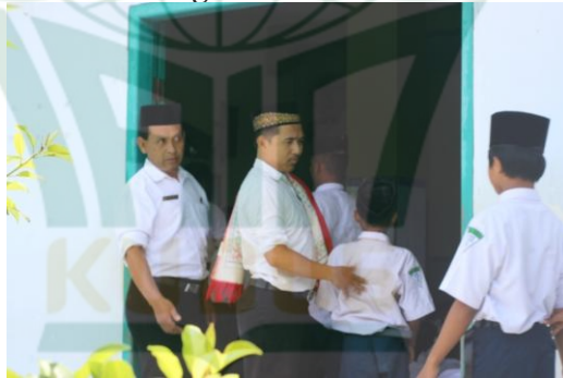
Gambar 4.3 Guru Sedang Menertibkan Siswa

Pada Gambar 4.4 terlihat bahwa guru sedang menertibkan siswa untuk segera masuk ke masjid. Tugas guru memastikan siswa melaksanakan sholat berjamaah dengan khusus