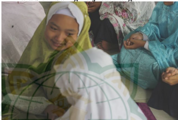
Gambar 4.5 Para Siswi Saling Berjabat Tangan

Pada Gambar 4.5 terlihat para siswi sedang berjabat tangan se usai sholat berjamaah. Kebanyakan siswa Mts Negeri 4 Demak berasal dari desa. Masyarakat desa terkenal dengan karakter yang santun dan berjiwa sosial tinggi. Karakter tersebut kemudian dibawa para siswa yang mayoritas dari desa yang kemudian diterapkan di madrasah. Ritual keagamaan yang dilakukan secara berjamaah memiliki fungsi sosial yang tinggi. Misalnya berjabat tangan setelah sholat. Setelah berdo'a bersama, imam sholat memberikan nasehat kepada siswa-siswi.