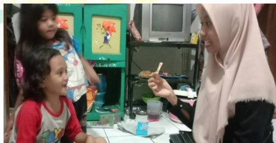
Gambar 4.2 Anak disleksia menyebut huruf c menjadi e .

Kemampuan menulisnya juga mempengaruhi anak disleksia dalam mengenali huruf. Ketika guru memberikan pertanyaan mengenai huruf yang sudah ditulis anak disleksia sering menjawab terbalik antara huruf yang lafal dan bentuknya hampir sama.