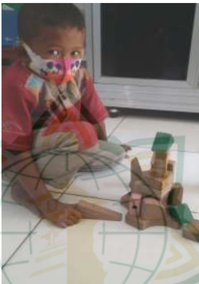
Foto kegiatan anak bermain dengan balok di RA Matholi'ul Falah Pati:

Manfaat yang didapat saat anak bermain balok adalah: pada aspek kognisi, menyatukan ide, dapat belajar cara untuk berkomunikasi dengan orang lain, Memahami dan mengerti tentang seni dan keindahan, anak akan terlatih untuk bersabar.