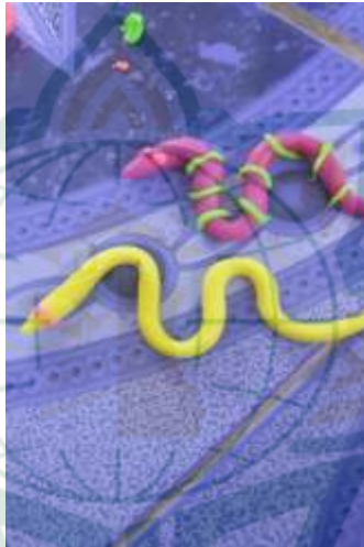
Foto kegiatan bermain dengan plastisin/ playdought di RA Matholi'ul Falah Pati.

Respon anak di RA Matholi'ul Falah Pati pada kegiatan bermain konstruktif anak dapat mengerjakan dengan cepat dan lancar dalam membentuk plastisin/playdought menjadi bentuk ular yang ukurannya sesuai dengan keinginan anak.