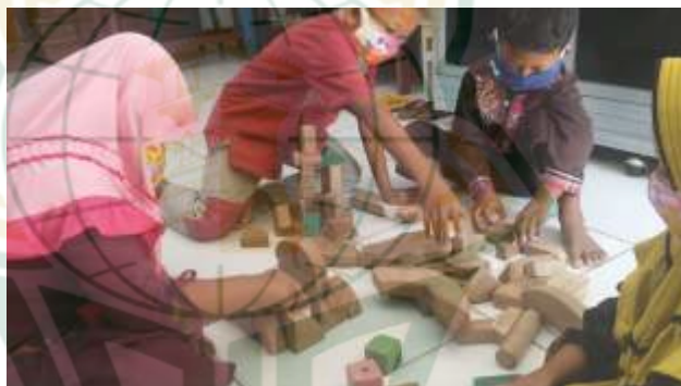
Foto kegiatan anak bermain dengan balok di RA Matholi'ul Falah Pati:

Saat bermain balok dan supaya anak dapat menciptakan bangunan baru yang tidak terpikirkan atau tidak terlihat oleh orang lain, maka guru memberikan permainan balok kepada anak dalam jumlah banyak.