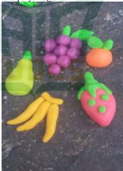
Foto kegiatan bermain dengan plastisin/playdought di RA Matholi'ul Falah Pati.

Guru memberikan dan menjelaskan contoh bentuk yang akan di buat oleh anak, supaya dengan bermain plastisin/playdought anak dapat membuat berbagai macam bentuk dengan cepat.