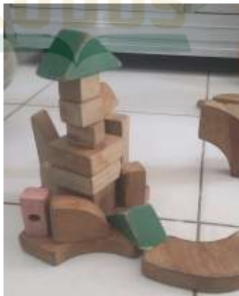
Foto kegiatan anak bermain dengan balok di RA Matholi'ul Falah Pati:

Guru selalu memberi tugas individu kepada anak sehingga anak dapat memunculkan idenya saat bermain, supaya dengan bermain balok anak dapat mencipta bangunan baru dari idenya sendiri.