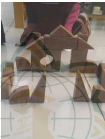
Foto kegiatan anak bermain dengan balok di RA Matholi'ul Falah Pati:

Pembelajaran dengan bermain balok supaya anak dapat menciptakan bangunan baru dengan penuh kesabaran, maka guru mendampingi dan membimbing anak pada saat anak mencipta bentuk bangunan”.