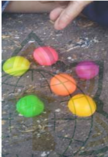
Foto kegiatan bermain dengan plastisin /playdought di RA Matholi'ul Falah Pati.

Berdasarkan hasil pengamatan pada pembelajaran di Matholi'ul Falah Pati pada kegiatan bermain konstruktif anak mampu memperluas ide dan aspek-aspek yang mungkin tidak terpikirkan atau terlihat oleh orang lain dalam membentuk plastisin/playdought menjadi bentuk bola yang berwarna-warni.