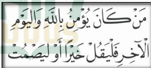
Gambar 2.2. Contoh khath naskhi

Khath ini disebut naskhi karena tulisannya digunakan untuk menaskahkan atau membukukan Alquran dan berbagai naskah ilmiah yang lain sejak kurun pertama Hijrah. Pendapat lain mengatakan bahwa nama naskhi diberikan karena peranannya menasakhkan yang artinya menghapuskan atau menggantikan penggunaan khat kufi dalam penulisan wahyu Allah yaitu Alquran.