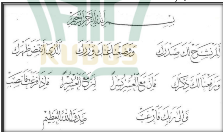
Gambar 2.7. Contoh khath ijazah

Khath ijazah merupakan campuran dari dua gaya khath , yaitu naskhi dan tsulutsi . Dinamakan ijazah karena gaya khath ini pada perkembangan awalnya digunakan untuk penulisan syahadah atau ijazah , yaitu surat izin berbentuk dokumen yang diberikan kepada pelajar yang telah berhasil menyelesaikan pelajarannya, termasuk pelajaran pendidikan khath sebagai tanda bahwa yang bersangkutan mempunyai wewenang untuk menyebarkan ilmu yang diperolehnya.