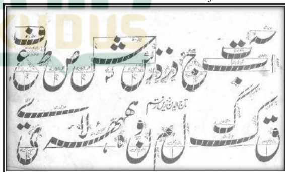
Gambar 2.4. Contoh khath fairsi

Istilah faritsi atau farsi berasal dari nama daerah, yaitu Persia. Daerah ini terkenal dengan dengan budaya seninya yang turun temurun, termasuk seni menulis. Tradisi seni yang turun temurun ini kemudian bersentuhan dengan ajaran Islam yang membawa ajaran wahyu Allah yang tertulis dengan huruf Arab. Berkembanglah sebuah gaya tulisan yang disebut faritsi . Khat faritsi adalah sejenis khath yang memiliki postur agak condong ke sebelah kanan, huruf-hurufnya sering memiliki ketebalan yang tidak sama secara mencolok, maka diperlukan lebih dari satu pena dalam penulisannya.