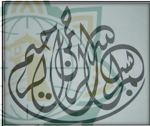
Gambar 2.5. Contoh khath diwani

Muhammad al-Fatih pada tahun 857 Hijrah. Sebutan diwani diambil dari kata diwan yang dalam bahasa Indonesia diistilahkan dengan dewan , kumpulan orang yang bekerja mengurus masalah-masalah kenegaraan. Munculnya sebutan diwani karena khath ini sering digunakan sebagai tulisan-tulisan resmi kenegaraan. Ciri khas khath diwani adalah lengkungan-legkungan lentur, posturnya miring ke kiri secara bersusun dengan corak hias yang menonjol menampakkan keindahan.