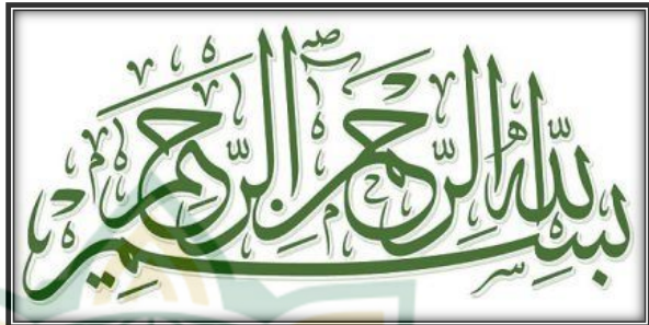
Gambar 2.3. Contoh khat tsuluts

dari 24 helai bulu kuda. Maka jadilah nama tsuluts (1/3) yaitu delapan helaian bulu kuda.