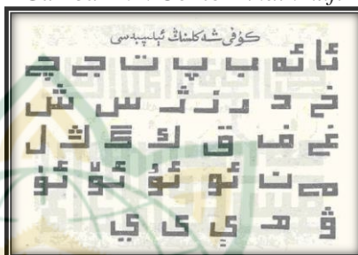
Gambar 2.1. Contoh khath kufi

ciri-ciri khath kufi adalah bersegi, tegak, dan bergaris lurus.