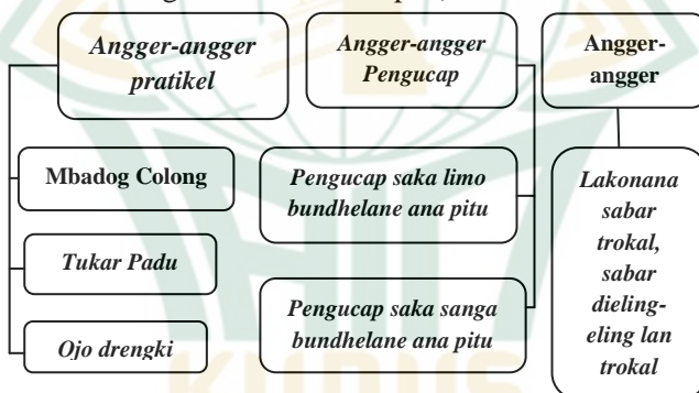
Gambar 2.2 Hukum dalam Berkehidupan

bundhelane ana pitu lan pangucap saka sanga bundhelane ana pitu (pangucap dari sumber yang lima, pengendaliannya ada tujuh, pangucap dari sumber sembilan pengendaliannya juga ada tujuh). Angka-angka ini berarti; limo bermakna jumlah panca indera (penglihat, pendengar, perasa, penciuman, dan pengecap), songo bermakna jumlah lubang manusia ada sembilan (2 di mata, 2 di telinga, 2 di hidung, 1 di mulut, 1 lingga/yoni, 1 anus) dan pitu bermakna lima lubang manusia bagian atas (2 di mata, 2 di telinga, 2 di hidung, 1 di mulut). Ketiga , hukum angger-angger lakonana mempunyai ungkapan lakonana sabar trokal, sabare dieling-eling, trokale dilakoni (kerjakan sikap sabar dan giat, agar selalu ingat tentang kesabaran dan selalu giat dalam kehidupan).