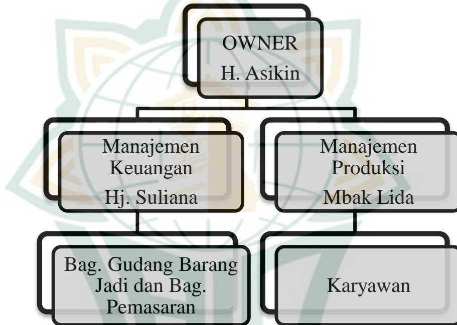
Gambar 4.3 Struktur Organisasi Lida Jaya Konveksi 14

Struktur organisasi adalah suatu susunan dan hubungan antara setiap bagian baik posisi maupun tugas yang ada pada perusahaan dalam menjalankan kegiatan operasional untuk mencapai tujuan.