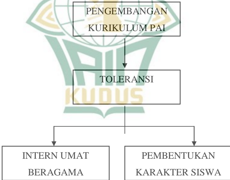
Gambar 2.1. Skema Kerangka Berfikir Penulis

Kerangka berpikir yang telah diuraikan diatas secara ringkas dapat digambarkan dalam bentuk bagan berikut ini: