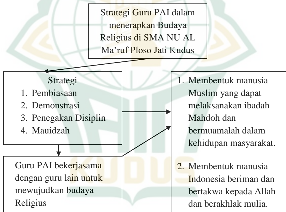
Gambar 2.2 Kerangka Berpikir Strategi Guru PAI dalam Menerapkan Budaya Religius

Proses penciptaan Budaya religius terbentuk, ketika Guru PAI melakukan perannya dengan menerapkan perencanaan pembelajaran yang terukur dan terprogram yang di dukung dengan pemilihan strategi yang tepat maka proses terwujudnya Budaya religius akan dapat terlaksana dengan baik.