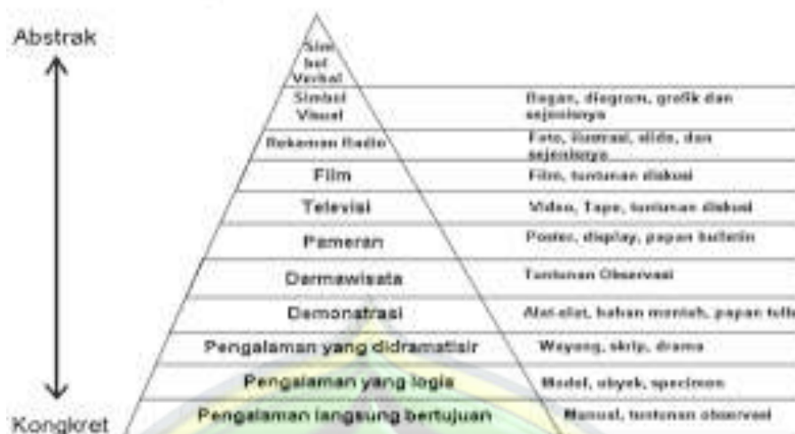
Gambar 2.2: Kerucut Pengalaman Edgar Dale

Adapun film yang baik yang digunakan sebagai media pendidikan memiliki ciri-ciri sebagai berikut: