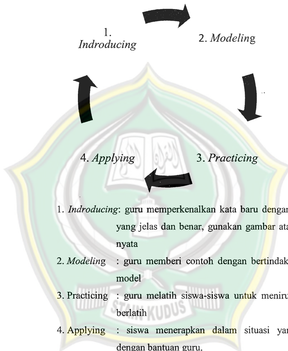
Gambar 2.1 Tahap Pembelajaran Kosakata