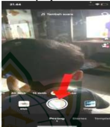
Gambar 4.7 Menu Kamera Untuk Menyimpan Video TikTok