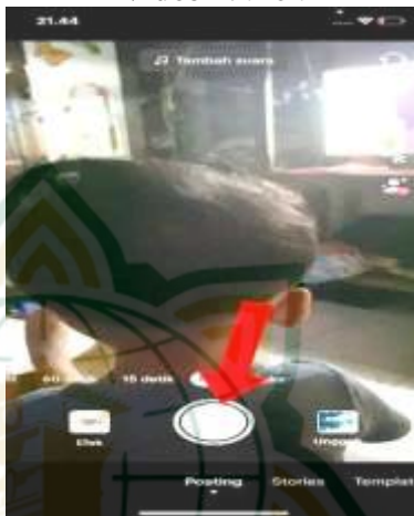
Gambar 4.6 Menu Kamera Untuk Merekam Video TikTok