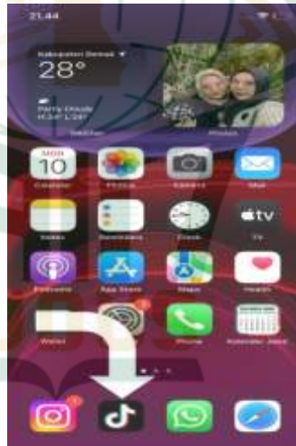
Gambar 4.1. Aplikasi TikTok Yang Telah Terdownload Di HP