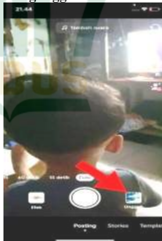
Gambar 4.3 Menu Kamera Untuk Mengunggah Video TikTok