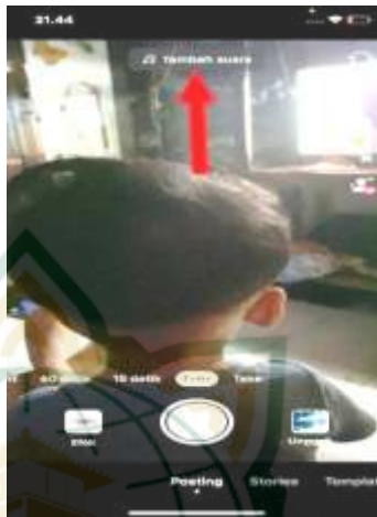
Gambar 4.5 Menu Kamera Untuk Menambahkan Efek Suara TikTok