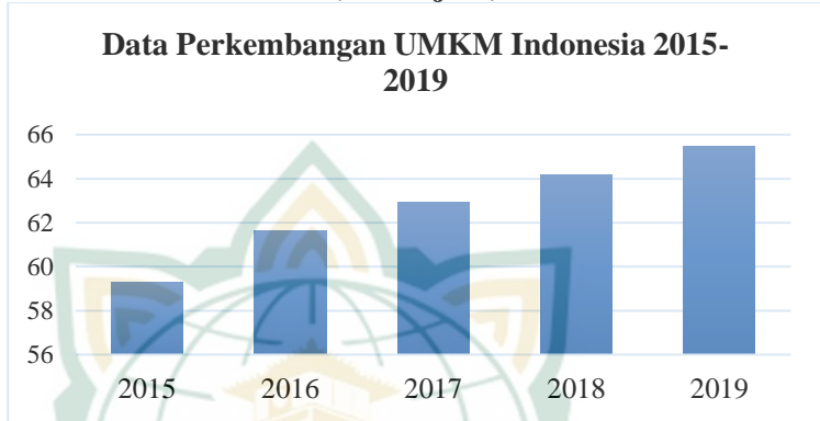
Gambar 1.1 Data Perkembangan UMKM di Indonesia Tahun 2015-2019 (dalam juta)

bersertifikasi halal. 3 Sebanyak 80% produk belum bersertifikasi halal. 4