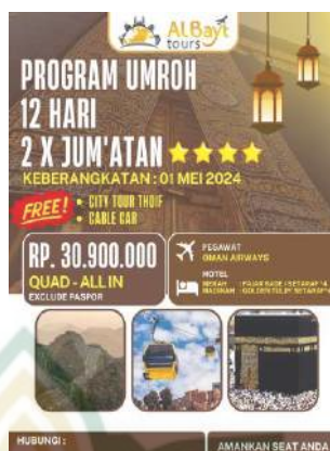
Gambar 4. 3 contoh brosur