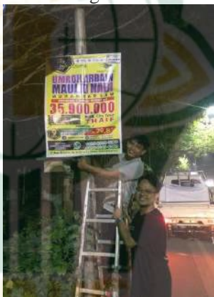
Gambar 4. 2 Pemasangan Benner Dipinggir Jalan

Pemasangan banner dilaksanakan 3 bulan sekali dengan pemasangan di titik- titik yang dapat dibaca semua orang seperti lampu merah dan tikungan